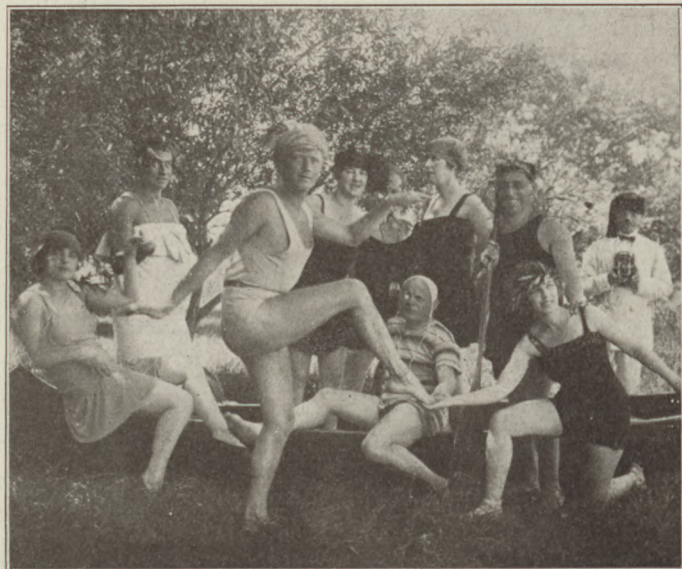
Vidám jelenet a balatonföldvári majomszigeten.