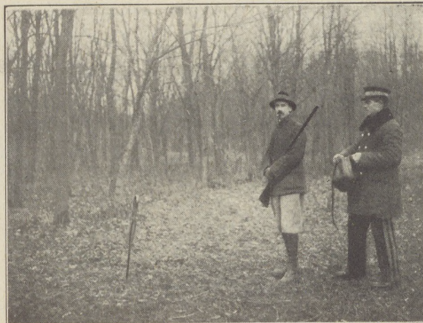
Képek a mezőhegyesi vadászatról: 1. A kormányzó fogadtatása. 2. Gróf Bethlen István.