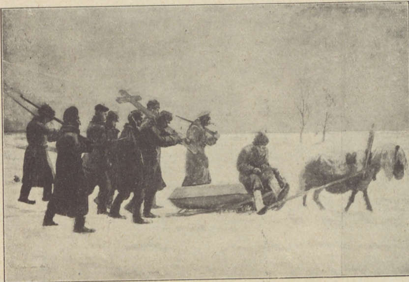
Szegedy-Kovács Ágoston festménye: Hadifogolytemetés Szibériában