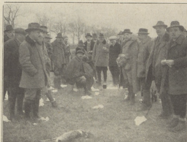
Képek a mezőhegyesi vadászatról: A miniszterelnök és pihenő vadásztársai.