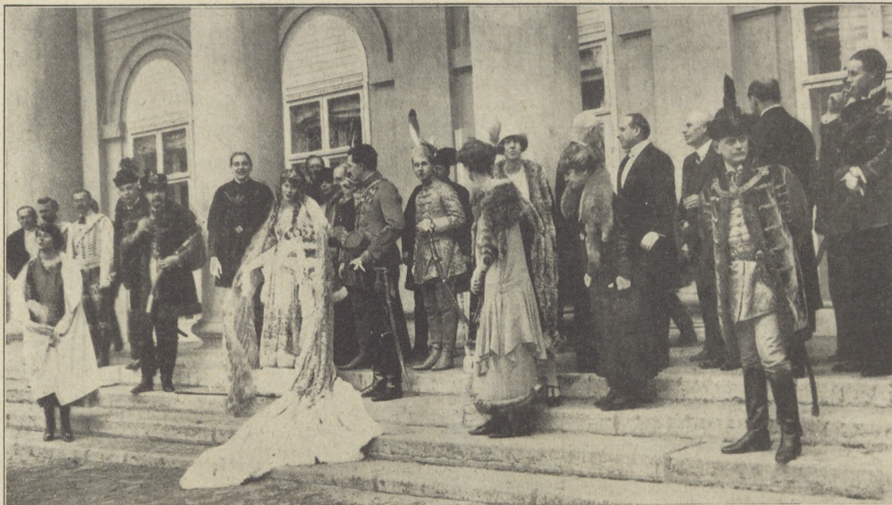
A Semsey-Károlyi esküvő: A fiatal pár és a násznép a kastély bejáratánál.