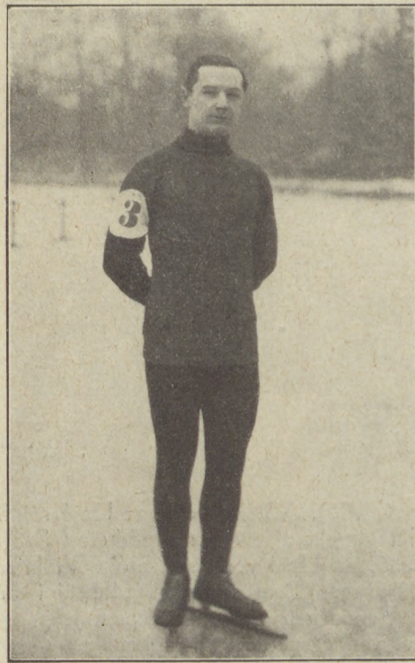
Eötvös Zoltán, gyorskorcsolyázó bajnok.