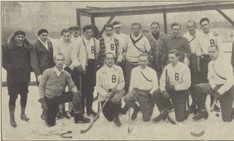
A lipcei jég hockey-csapat.

Mínthogy egyenlő pontszámok esetén a gólarány a döntő, a Csáky-dij győztese a BKE lett. Ezzel a győzelmével, mínthogy a díj végleges elnyerése két egymásutáni győzelemhez volt kötve, a Csáky-dij a BKE tulajdonába került.