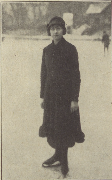
Tóth Gitta, műkorcsolyázó bajnok.

A hölgybajnokságot is a tavalyi védő Tóth Gitta nyerte. Könnyed, biztos mozgása és nagyobb rutinja biztosította első helyét Stiber Sárival szem-