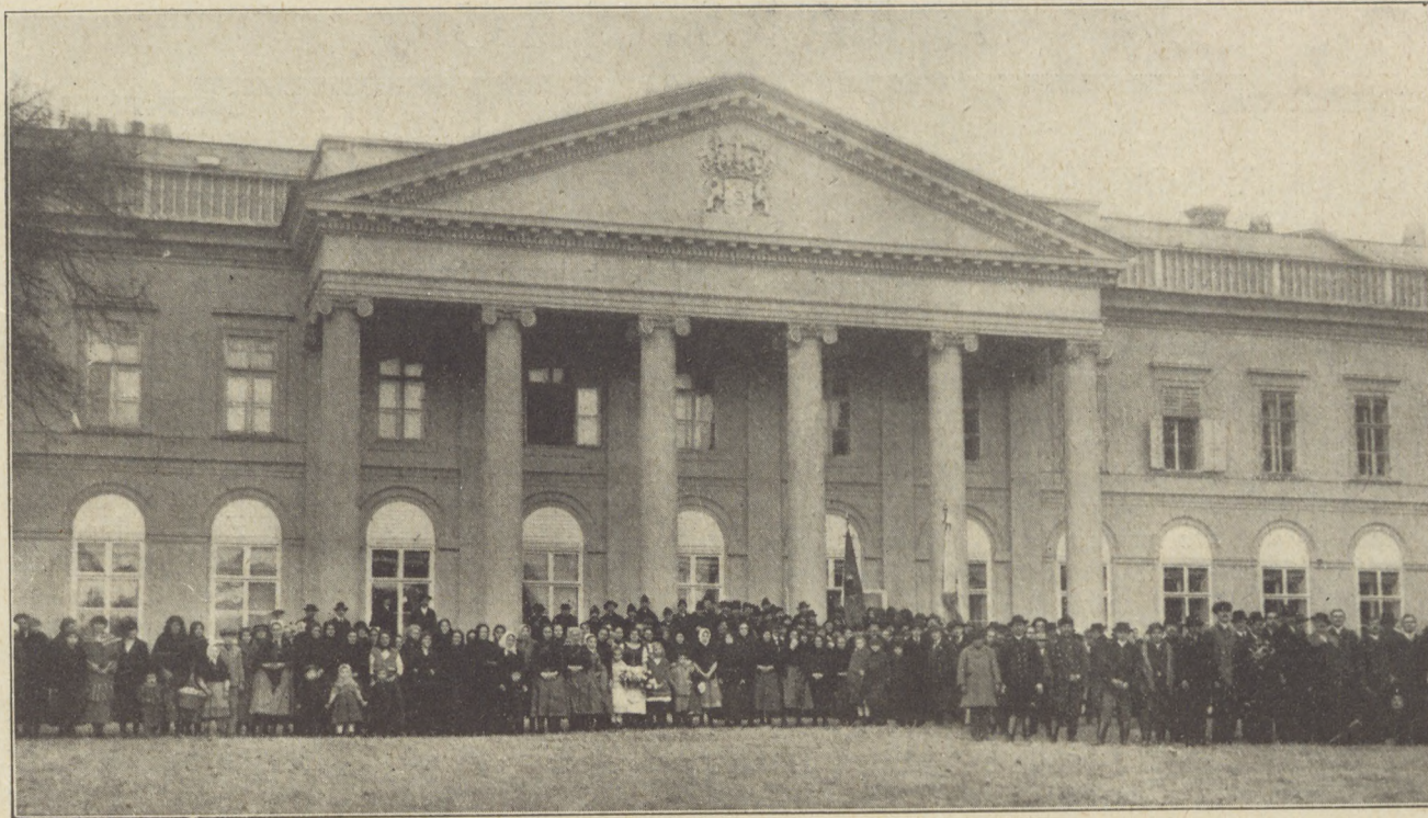
A Semsey-Károlyi esküvő: Küldöttségek a kastély előtt.