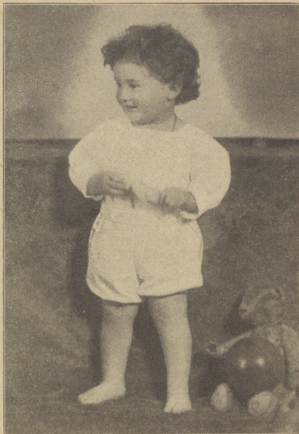
gróf Wenckheim Szigfried.