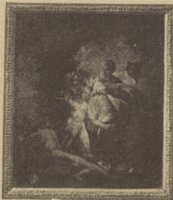
„Akinék Isten adott, adion a gyermeknek, mert aki a gyermeknek ad, az az Istennek ad.” Rákosi Jenő.

Új előfizetőnek, ha legalább félévre előfizet, az első lappéldányhoz a »Bridge-szabályok«-at mellékeljük.