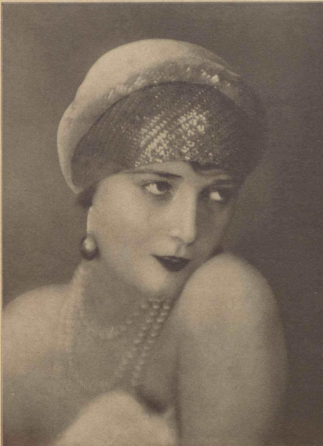
Bánky Vilma, az Amerikába szerződött filmdiva