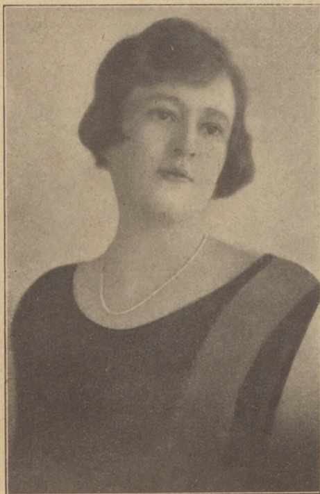
Pécsi Egyetemi Bálon