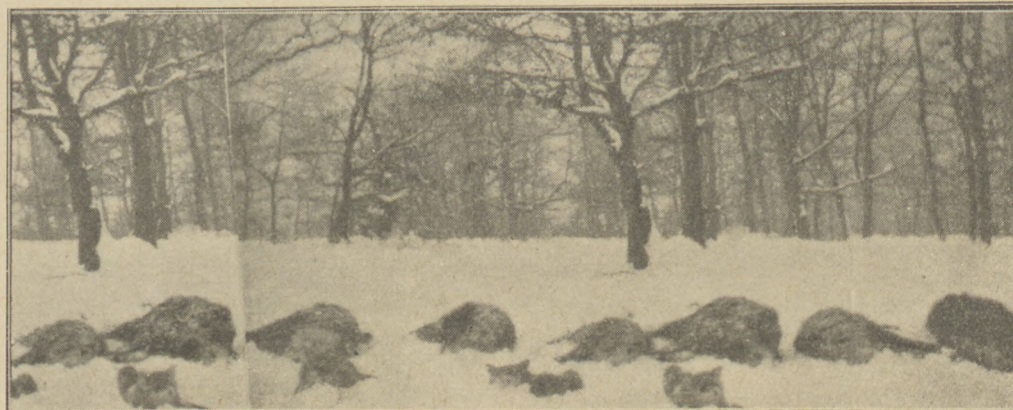
A szőri vadászat terítéke.

február 25-én tartjuk meg azon hölgyek között, akik előfizetőink, azonkívül ezen időpontig szerkesztőségünkhöz intézett levelezőlapon bejelentik, hogy kutyakedvelők és reflektálnak a szóbanforgó kutyára, mely sorsolás után átvehető.