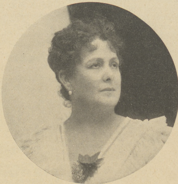
Blaha Lujza a nyolcvanas évekből

Az örök szépségnek, az örök tavasznak bájos megtestesülése elment az örökkévalóságba. A magyar néplélekből fakadó érzéseknek leghivatottabb tolmácsolója, a magyar dal génusza itt hagyta a hazáját, hogy elfoglalja helyét a halhatatlanságban. Az igazi magyar asszony, a mi csalogányunk, csupa kedvesség volt, csupa szeretetreméltóság és ragyogó fiatalságtól élete alkonyáig derűs kedélyével, istenáldotta, aranyos vidámságának közvetlenségével, igaz művészetének utánozhatatlan varázsával mindenkor megigézte a sziveket. Nagyságát, diadalait, csodás művészetét, játékának lebilincselő természetes