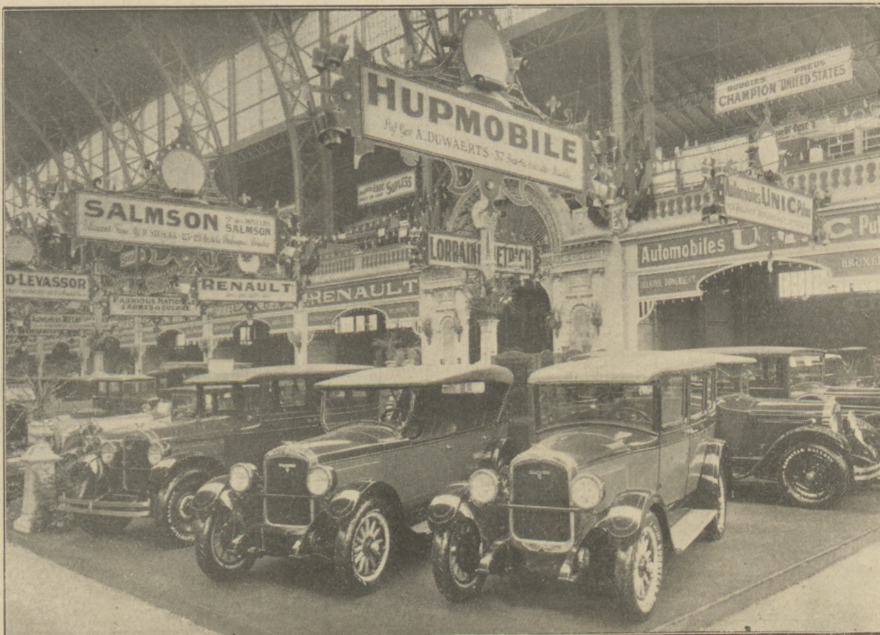
Az amerikai HUPMOBILE-gyár nagy feltűnést keltett 6 és 8 hengeres kocsiinak kiállítása Bruxellesben.