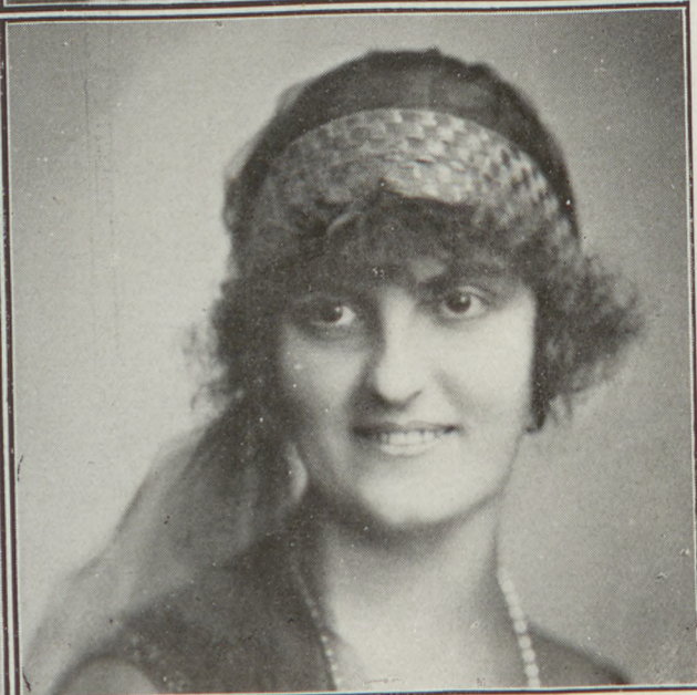
A Nemzeti-bál fenséges fővédnökei