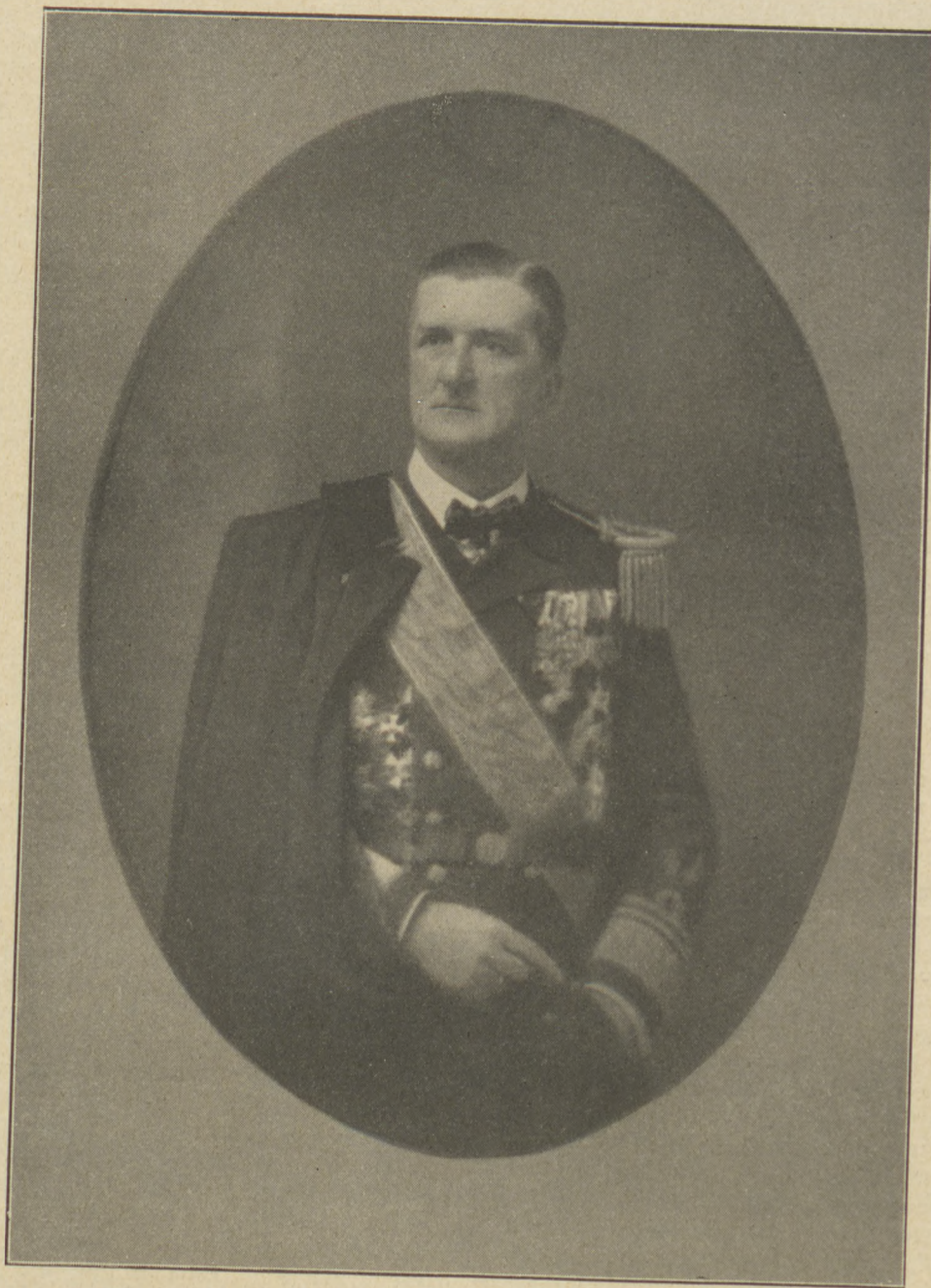
nagybányai vitéz Horthy Miklós, a Magyar Nemzeti-bál legfőbb védnöke