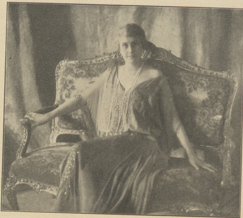
nagybányai vitéz Horthy Miklósné , mint a Magyar Nemzeti-bál fővédnöknője