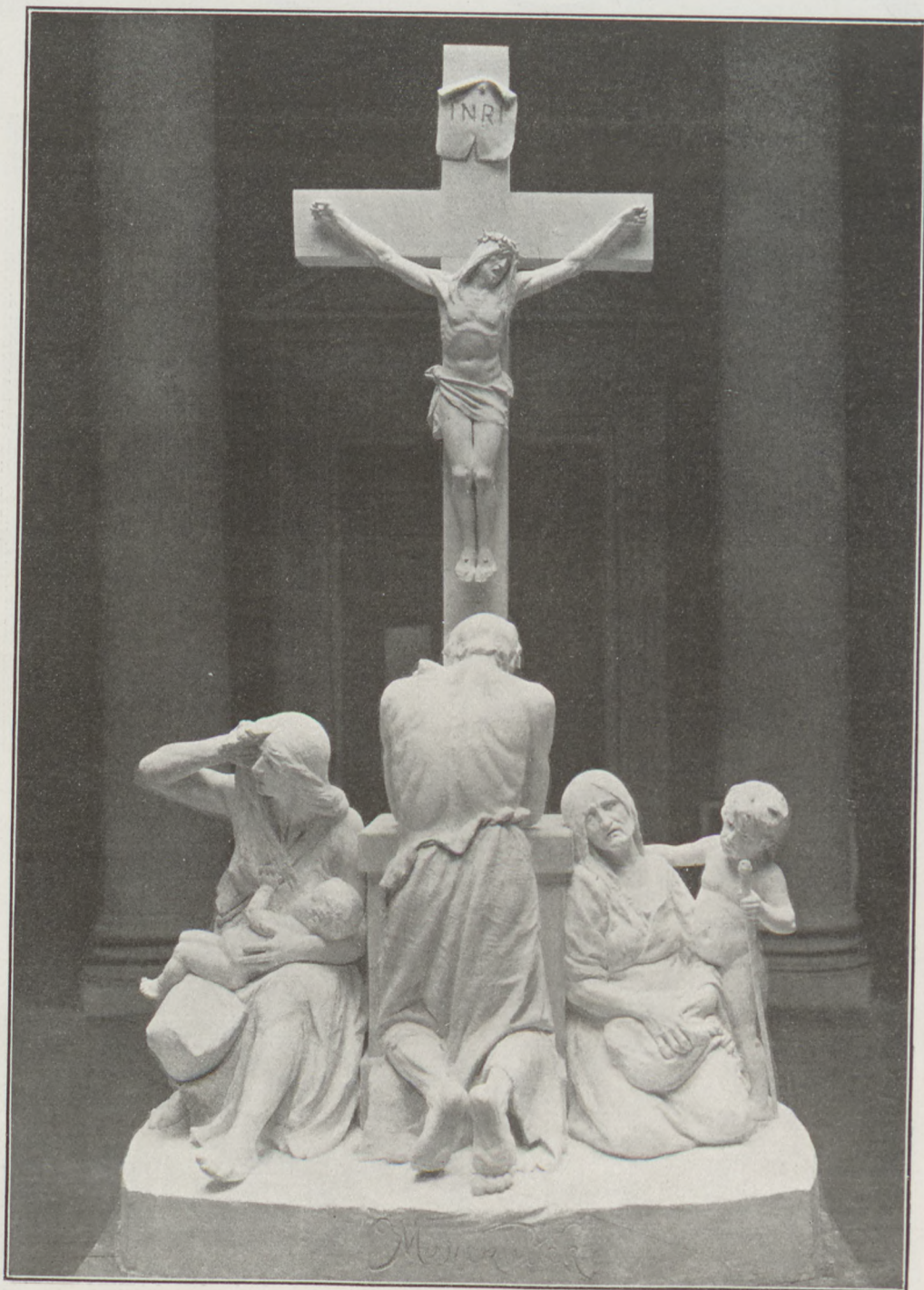
„A menekültek“ Andrejka József műve a téli tárlaton