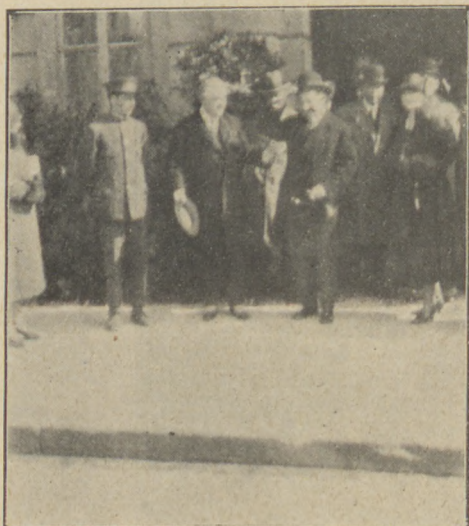
Costa népszövetségi elnök elhagyja az üléstermet