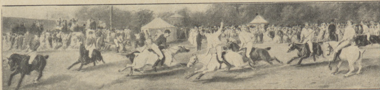
Az első lovaspolo-mérkőzés Angliában 1877 július 7. A királyi lovasgárda és a testőrgárda küzdelme. (Egykorú rajz után.)