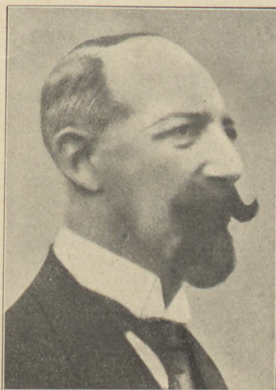
Guise herceg (a francia royalisták új királyjelöltje)