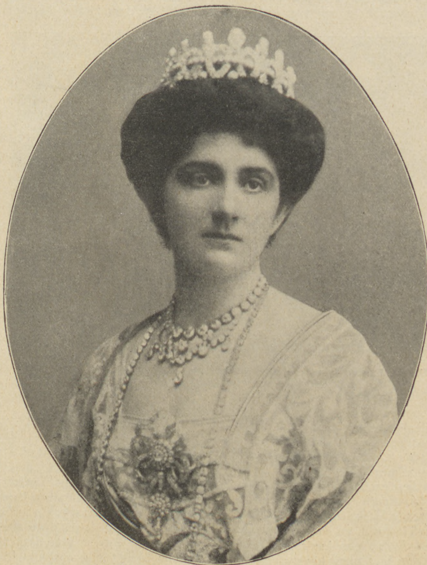
Eléna olasz királyné

Előfizetési ára: 1 évre 320.000, \frac{1}{2} évre 180.000, \frac{1}{4} évre 100.000 K Egyes szám ára: 10.000 K