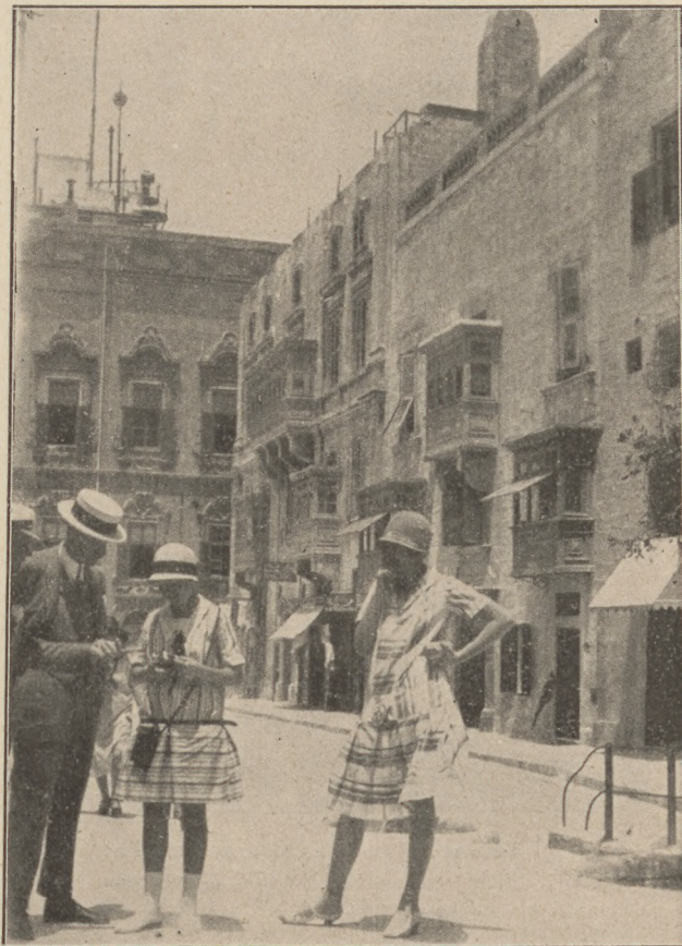
Társas hajóutazás Olaszországba:

lakossága javarészből angol, míg a született máltaiak a szigetcsoporthoz egyéb, körülbelül 100 községében laknak inkább. A benszülött máltai asszonyok feketében járnak, fejükön egy speciális ernyőszerű fekete-fátyolos kalappal, mely egyformán védi őket a nap tüzelő sugaraitól és az esőtől, mely azonban itt