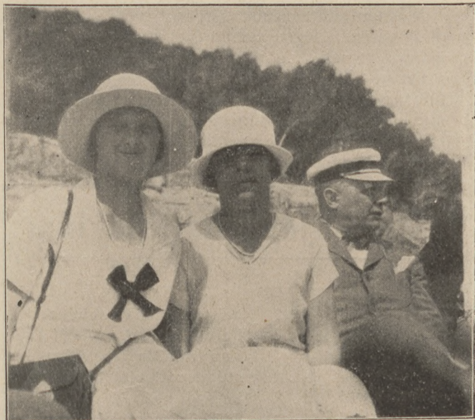
Társas hajóutazás Olaszországba:

Valetta városa kulturhely. Főutcájában élénk élet,