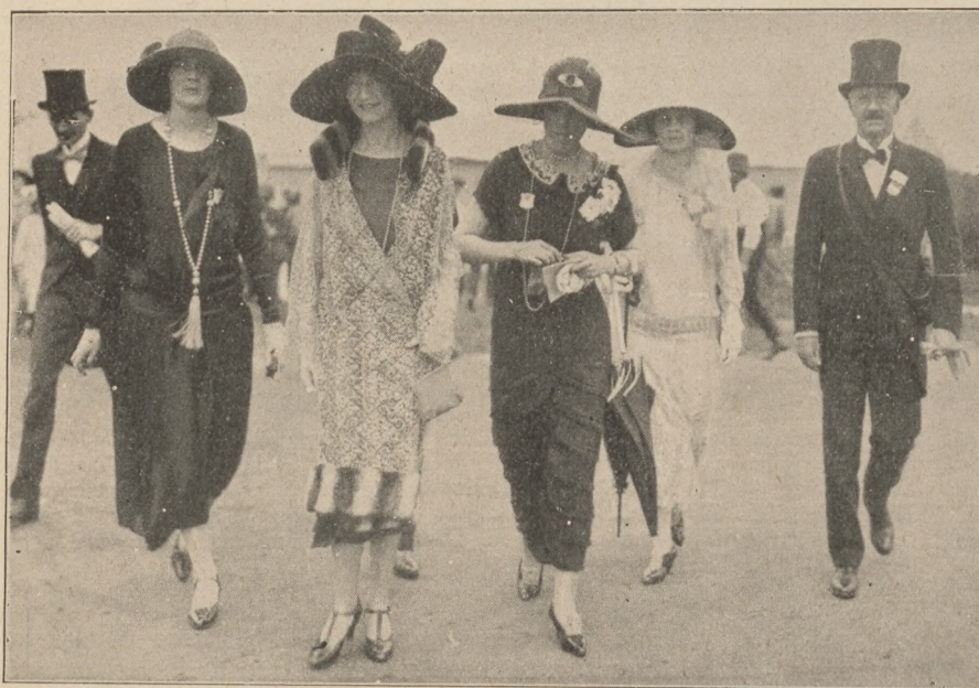
Előkelőségek az ascoti nagy versenyen

Az egyes futamok között van alkalom körülnézni. A tribünök közönsége tükrözi vissza az eredeti, a kontinensen sehol másutt fel nem található speciális angol divatot. A hölgyek öltözetének uralkodó színe ezúttal kék. A férfiak kivétel nélkül nélkül zsakettben és fekete, illetve szürke cilinderekben vannak. Érdekes, hogy bár nálunk a zsakettet halálra ítélték, Angliában mégis ez a legnépszerűbb ruhadarabok egyike. (Esküvőn például az angol gentleman kizárólag zsakettben jelenik meg!) Szemben a tribünökkel, a versenypálya belső oldalán, valóságos vásári élet nyúzsög. Bookmakerek százával sorakoznak fel egymás mellett és egymást túlharsozva igyekeznek fogadásra csalogatni a közönséget. Majd távolabb a sátraknak valóságos utcái terülnek el. Ezekben italokat, teát és kávét szolgálnak fel. Helyenként elvéve kis asztalok