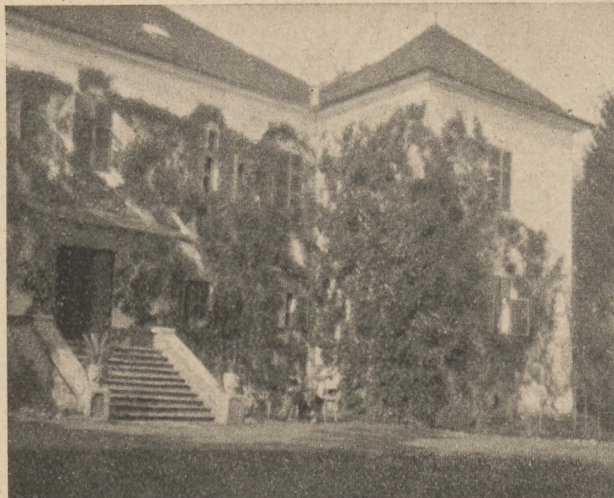
Az ungpiszkóczi Borsay-kastély.