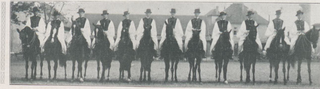
A soproni carousel lovasai