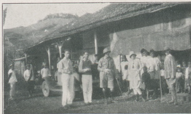
Expedíció a Szunda-szigeteken.