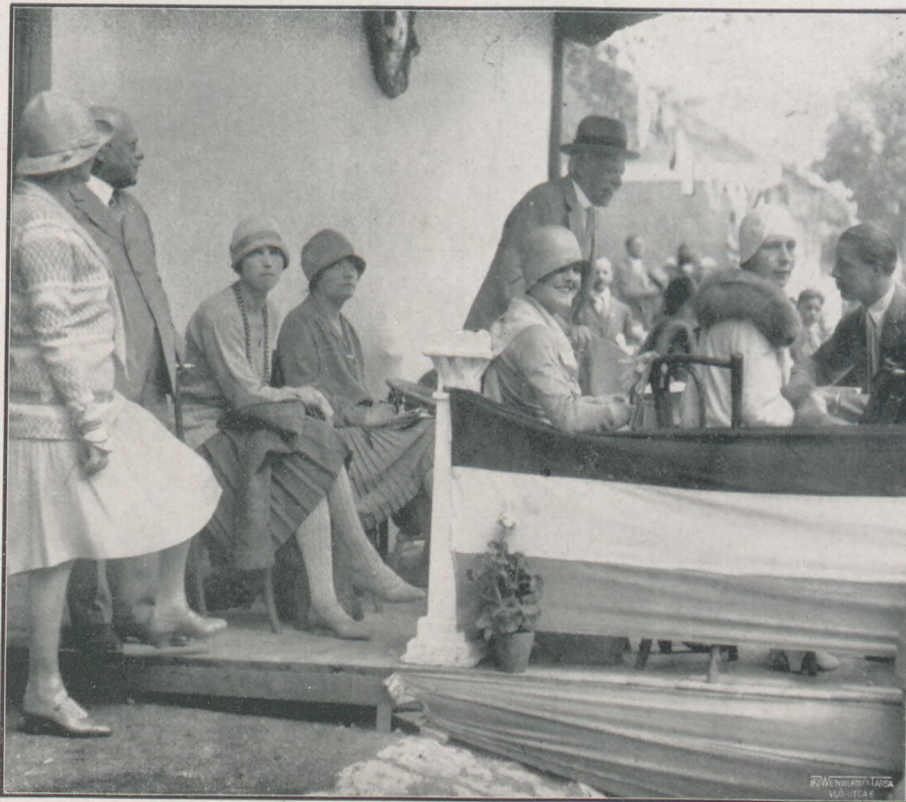
Hölgyközönség a Tourist Trophy verseny céljánál.