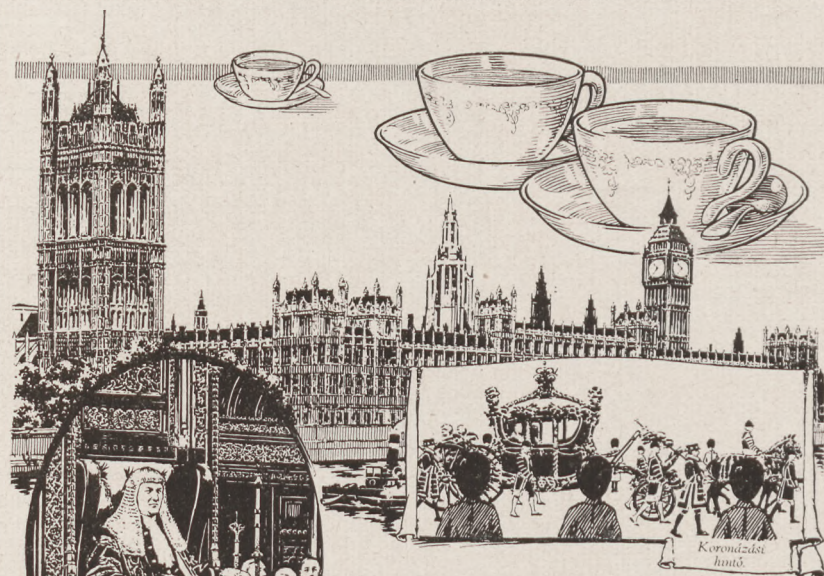
The Houses of Parliament

A parlament épülete, amelyet 1840-től 1857-ig kesői gótikában építettek, a „Clock-Tower“-rel, amelyben a híres, Big Ben néven ismert harang van, amelynek ünnepies kongását nem csak London minden látogatója, de a rádió feltalálása óta az egész világ oly-jól ismer a „Victoria Tower“-rel, együtt, amely a három torony közül a legmagasabb (336 láb magas). Hogy a parlament ülésezik-e, azt nappal a „Victoria Tower“-re felhúzott, „Union Jack,“ éjszaka pedig a „Clock Tower“-en elhelyezett fény jelzi.