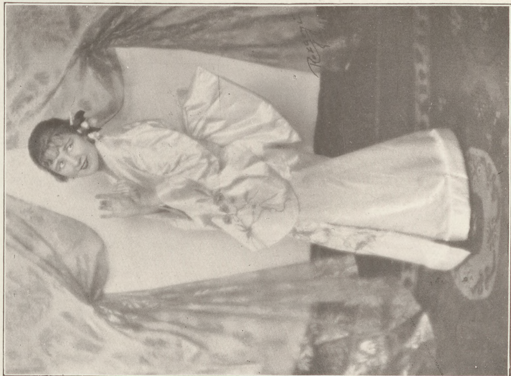
Kószegi Teréz operaénekesnő