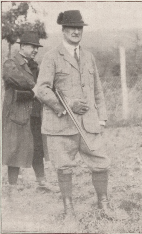
Horthy Miklós kormányzó a gödöllői vadászaton