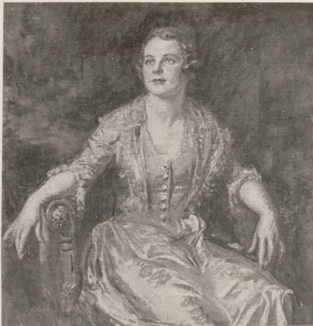
A Munkácsy-Céh első kiállításáról:

Doktor Schönherr idegesebb, kapkodóbb, hosszabb-szárú. Minden egyes, mereven szögletes meghajlásánál szinte összecukódik. Ha Don Quichotte Tirolban született volna, talán ilyen lett volna a külseje. A la manchai nemes lovag t. i. egészen megrögzött szellemű, egyszer már megállapított ideáitól semmi által el nem tántorítható úr volt. Schönherr dráiban, ha a