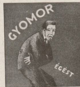
csak a Cigélkai forrásvíz gyógyít hatásosan