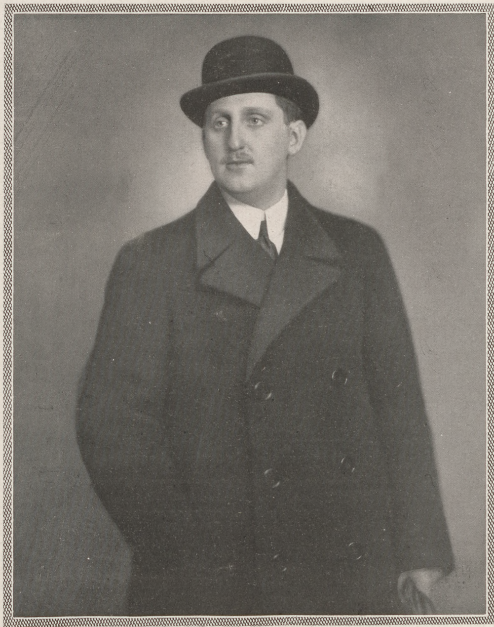
Fülöp Józsiás szász Cóburg góthai herceg

Előfizetési árak: Egy évre 25 P, félévre 14 P, negyedévre 8 P. Utólag fizetve \frac{1}{4} évre 10 P. Egyes szám 80 fill.