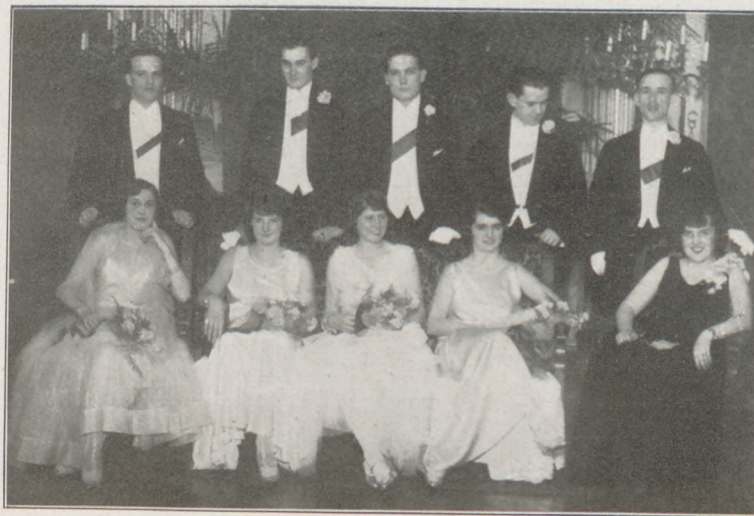
Akik a Jogászbált megnyitották