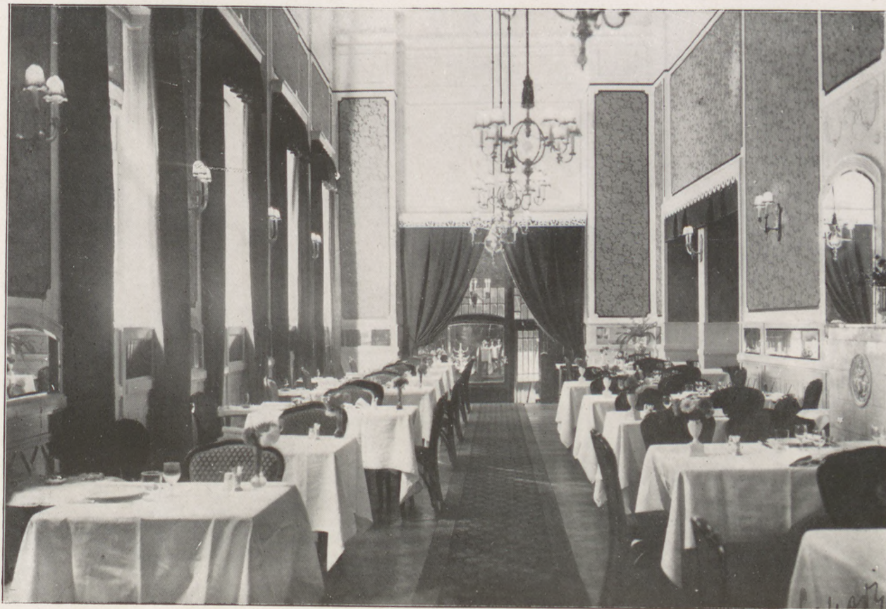
Holub (Kovács E. M.) étterem a belvárosi királyi bérpalotában

SVAJCI ÓRAS BUDAPEST IV., APPONYI-TÉR 5. SZ. TELEFON: A. 880-39