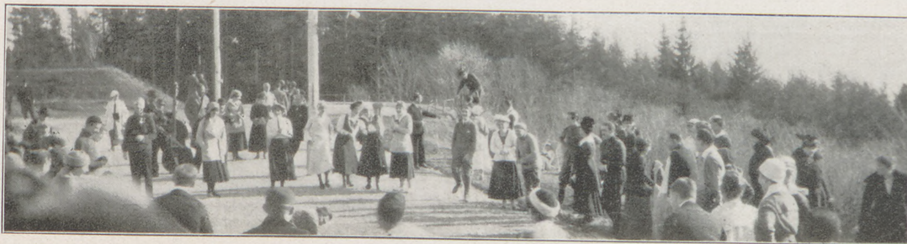
Táralomnici emlékek: Amikor nem volt hó, így szórakoztak a lomniczi Palace Hotel előtti téren 1917 telén