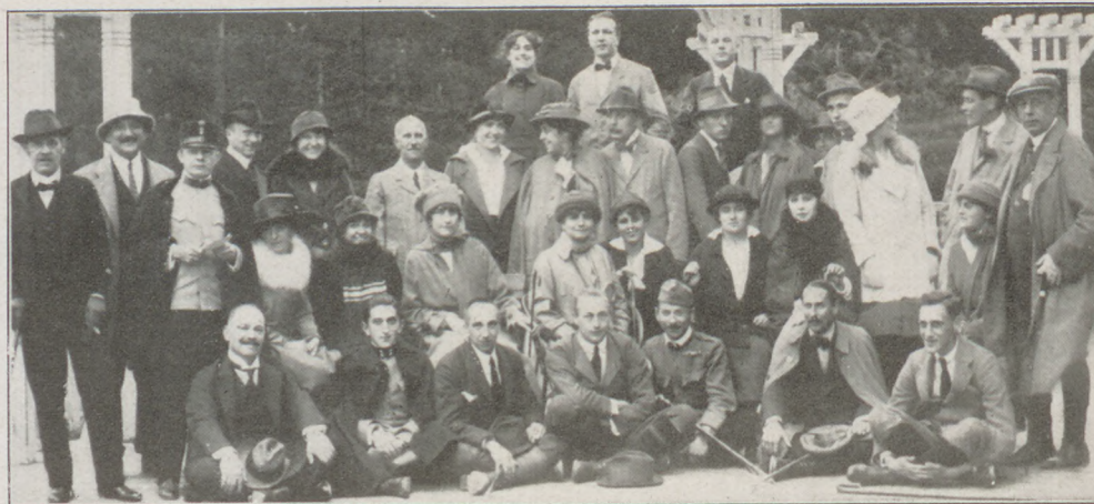
Az 1918. évi tátrai páros gyaloglóverseny résztvevői. (Az utolsó társadalmi esemény Lomnicon)

Az erkély korlátjára dőlve nézek le a színtérré... Elhómályosodik a szemem s mintha vízióim lennének s mintha nem is mult volna el azóta tizenkét év, akörnyezet hatása alatt, magam előtt lá-