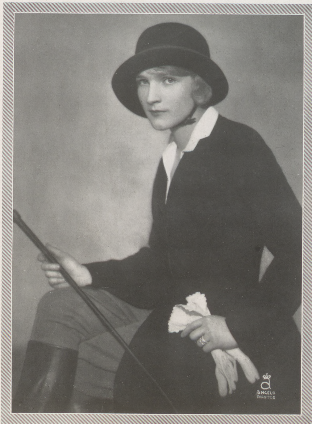
Auersperg Rudolphine grófnő