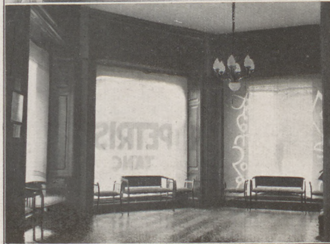
Herrensteini Petris Brunó, Budapest exclusiv közönségének tánctanára és táncterme, IV, Váci-u. 26 (Párisi-u. 2) Tel. 870-50

ESTÉLYI CREP DE CHINE CIPŐK modern elegáns kivitelben. — Hozott anyagból bármilyen modell szerint pengő 13.—tól pengő 22.—ig készülnek.