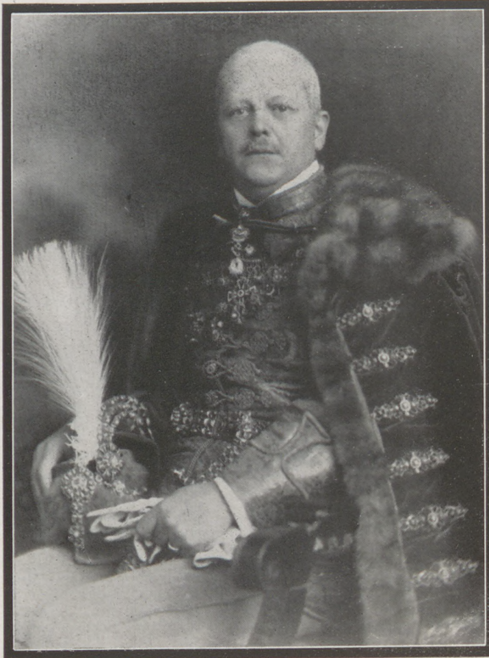
† herceg Batthyány-Straitmann László