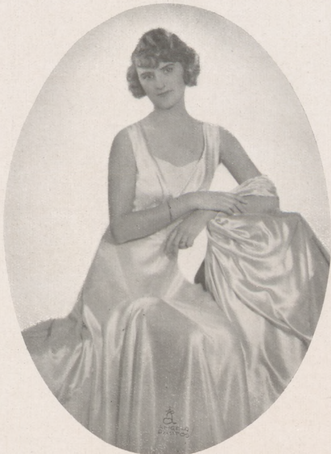
Bakody Ily az Atlétabálon

osztogat a hangulat emelésére. Ezt magával viszi az ifjúság a bálterembe s a léggömbök meg a szerepentinek tömege egész családias jelleget ad a mulatságnak, — mintha nem is egy nagy bálon volnánk. Az angyaloknak képzelt szebb leányokat: leveleki