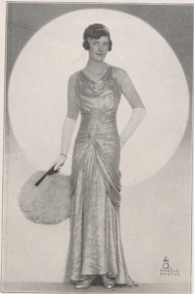
Wein Lily az Atlétabálon

szövegetett csillogó bálteremről, frakkos fiatalemberekről, bőditő keringő dallamára az első fordulóról. Oh Istenem, kivel is fog legelőször táncolni, ki fogja felvezetni s vajjon . . . , lám erre alig mert gondolni . . . , nem fog-e petrezselymet árulni a fal mellett? Álmaiban ott látta maga körül a fél Vigadó táncos ifjúságát, kik mind azon versengtek, hogy vele táncolhassanak, vele, a fehér túllrubás, szőke kisleánnyal.