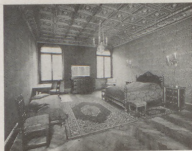
Pompás társalgóhelyiségek. Étterem. Bar. — Egész évben nyitva.

Gallér, finom fehérnemű különleges mosása olcsón, 1 nap alatt is. Király-gőzmosó festő és vegytisztító, IV, Magyar-u. 3. Tel.: 851-29.