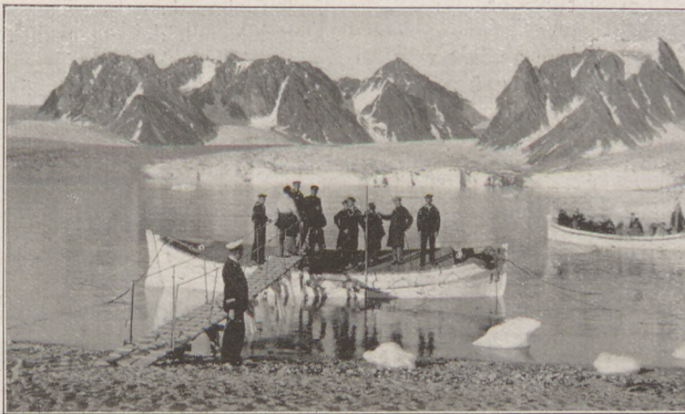
Hammerfest és a Nordkap. Képek a nyári tengeri hajóutunkhoz, mely július 3-án indul 16 napra a norvég fjordokhoz az Oceána levő luxus kiránduló gőzössel. Részvételi ár 470 M. Részleteket mult számunkban közöltünk.