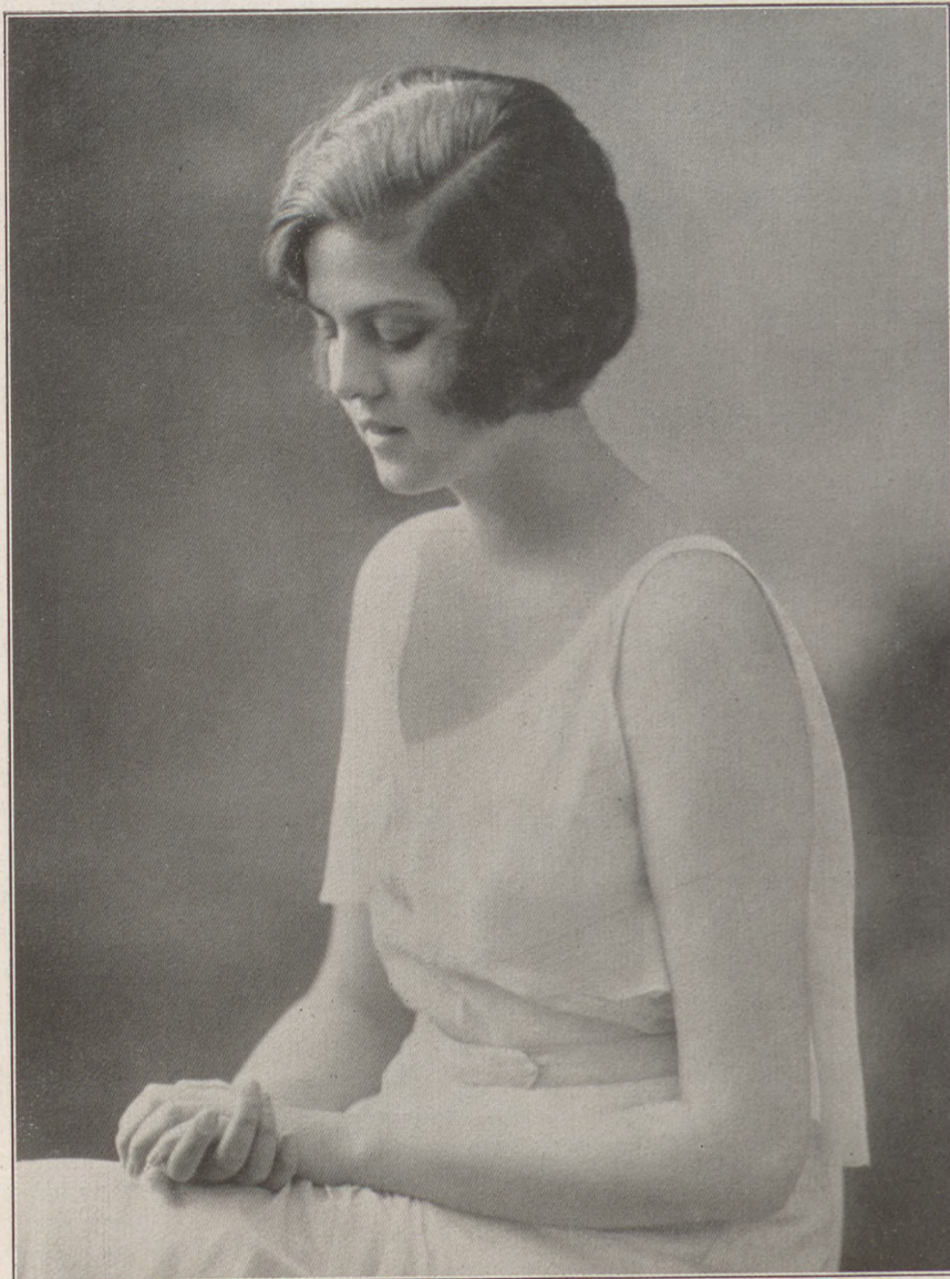
Thyssen-Bornemissza Margit bárónő

Előfizetési árak: Egy évre 25 P., félévre 14 P., negyedévre 8 P. Utólag fizetve ¼ évre 10 P. Egyes szám 80 fill.