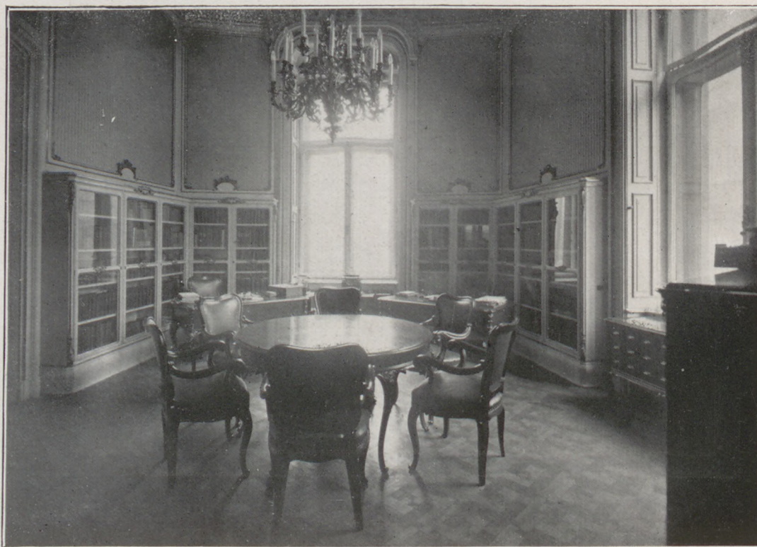
A „Budapesti Gyűjtemény“ dolgozószobája