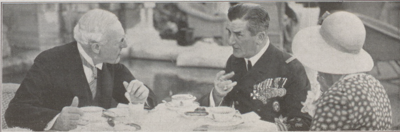
A Kormányzó Lord Dickinson és Lady Dickinson társaságában teázik a Garden-parlyn