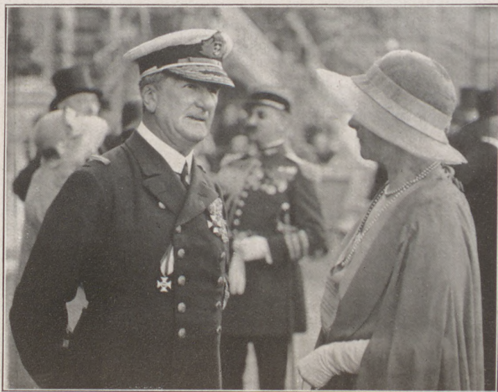
A Kormányzó és gróf Bethlen Istvánné a várkertii ünnepélyen