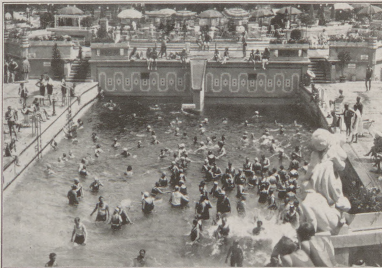
Megnyílt a Gellért-hullámfürdő