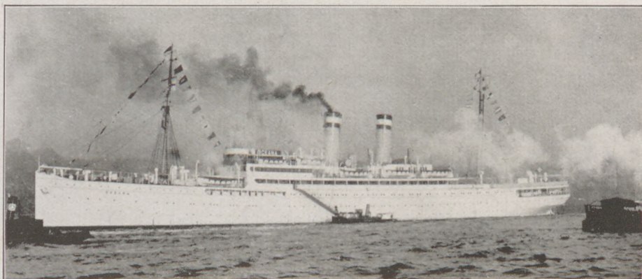
Az „Océana” luxusgőzös, mellyel július hó 3-20-ig a norvég fjordokhoz (a Nord- kapig) egy hajóutazást rendezünk. E célból a »Hapag« 10 helyet bocsátott rendelkezé- sünkre 470-520 RM. kedvezményes árban. Ebben az utazás és teljes ellátás bennfoglal- tatik. Felvilágosítás és jelentkezés főszerkesztőnknel. (Telefon: LÁ. 6-74)