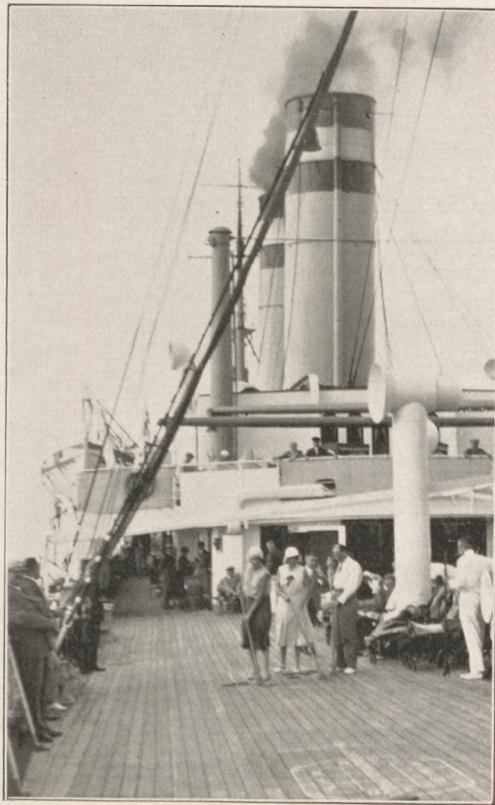
Egy Pesten ismeretlen fedélzeti játék.