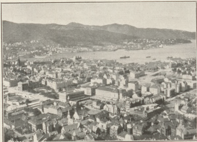
Bergen város látképe