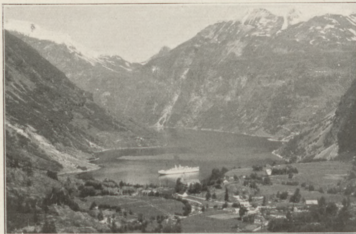
Az „Océána“ a Geiranger-fjordban Merok előtt