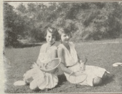
1. Pilya, 2. Pilya Baba és Vasváry Éva

elfelejtette vele. Ezek után következett a minden idegen részére el nem mulasztandó éjjeli lokál a Sziget vilanyfényben úszó csúcsán. A nagyszerű fogadtatás mindjárt elárulta, hogy itt alaposan be vannak rendezkedve az idegenekre, helyesebben a könnyelmű emberekre. Ebben úgylátszik senkisémm ellenőrizi és semmisémm fészélyezi őket. Egy gyűszűnyi konyakért annyit kérnek, amiért egy egész üveget megvehetne