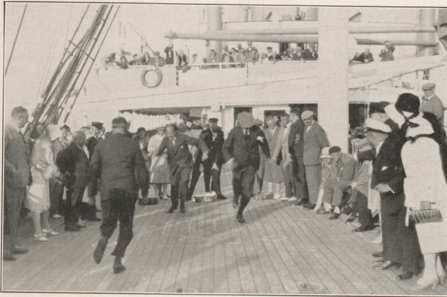
Tréfás verseny az összes utasok részvételével

Végül a kötélhúzás régi de egészséges küzdelmét kellett 12 hölgynek 20 férfi ellen eldönteni. Természe-