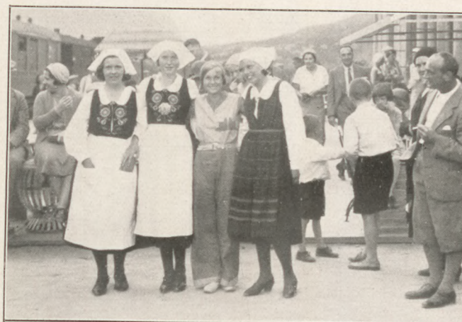
Norvég szépségek egyik vasúti állomáson

A legnagyobb pesti kánikula napján egyik gleccseren hűsöltünk