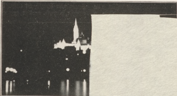
A kivilágított Halászbástya