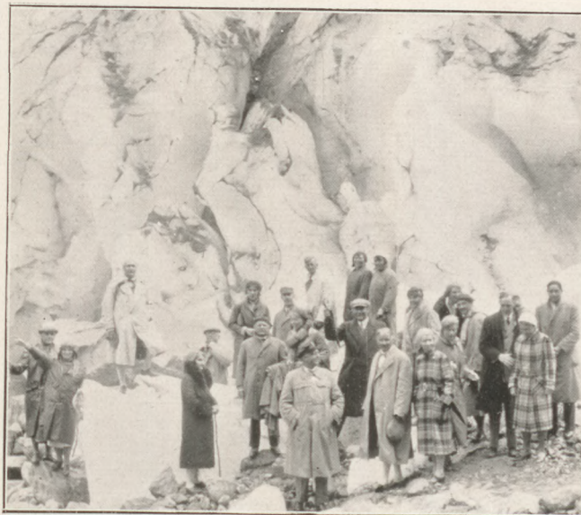
Az örök jég birodalmában