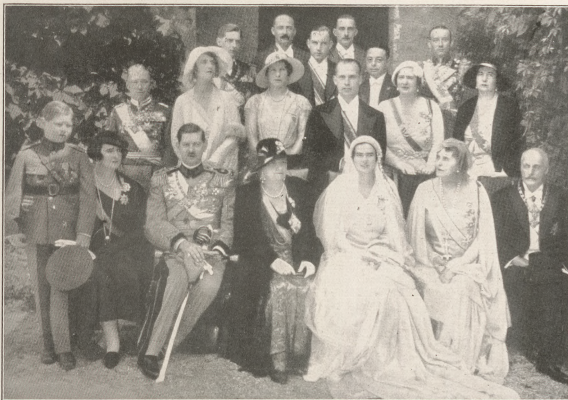
Nász a Habsburg-Hohenzollern családban. Ileana román kir. hercegnő és Antal főherceg esküvője Sinajában. Ülő sor balról: Mihály román trónörökös, Erzsébet volt görög királyné, Károly román király, Blanka főhercegasszony, a Menyasszony, Mária román anyakirályné, Lipót Salvátor főherceg.

Előfizetési árak: Egy évre 25 P., félévre 14 P., negyedévre 8 P. Utólag fizetve negyedévre 10 P. Egyes szám 80 fill.