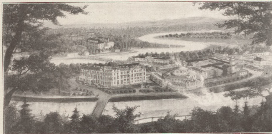
A Pöstyén-fürdői thermálsziget panorámája