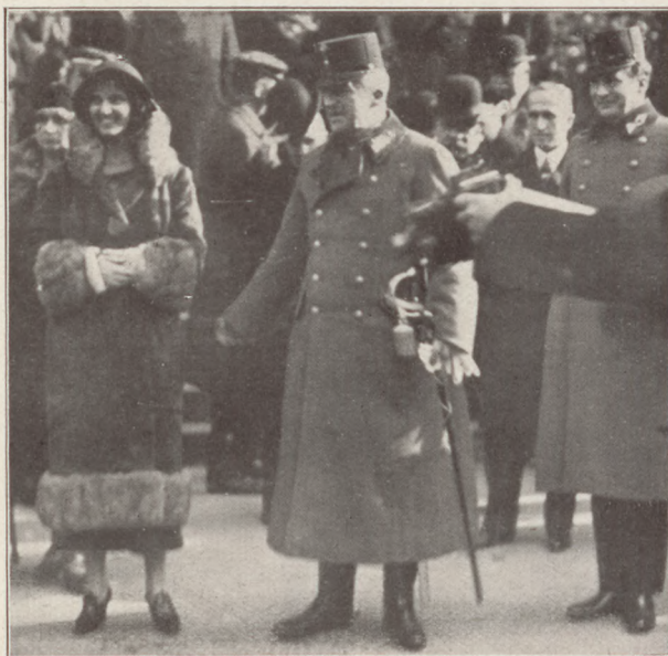
Az Americana vasárnapi jubileumáról:

Anna főhercegnő, József és József Ferenc főhercegek a Bazilika előtt