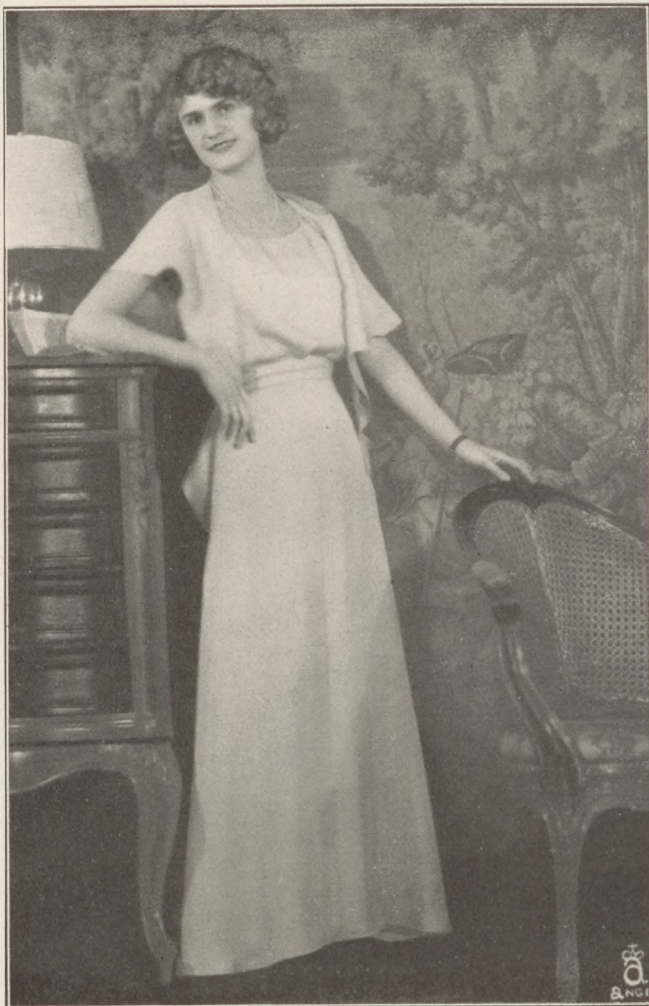
Bakody Ily a Medikusbálon

Ismét egy kitűnően sikerült elite-bálról számolhatunk be, amellyel bebizonyosodott, hogy nem volt igazuk azoknak, akik nem bíztak az ifjúság agilitásában, sem azoknak, akik a fiatal leányok bálozó kedvét féltették. Csak az történt, hogy a Medikusbál a Vigadó nagyterméből átköl-