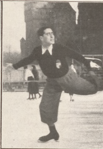
Vadas Márton , az 1932. évi műkorcsolyázás bajnoka