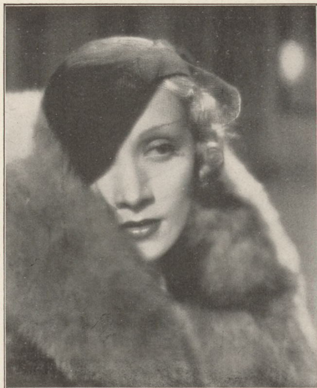
Marlene Dietrich a »Szőke Vénusz« főszereplője (Royal Apollo)

Augusztai főhercegasszony, Gömbös Gyula miniszterelnök, Isépy Aladár városparancsnok, Lieber Endre, valamint még sokan mások.