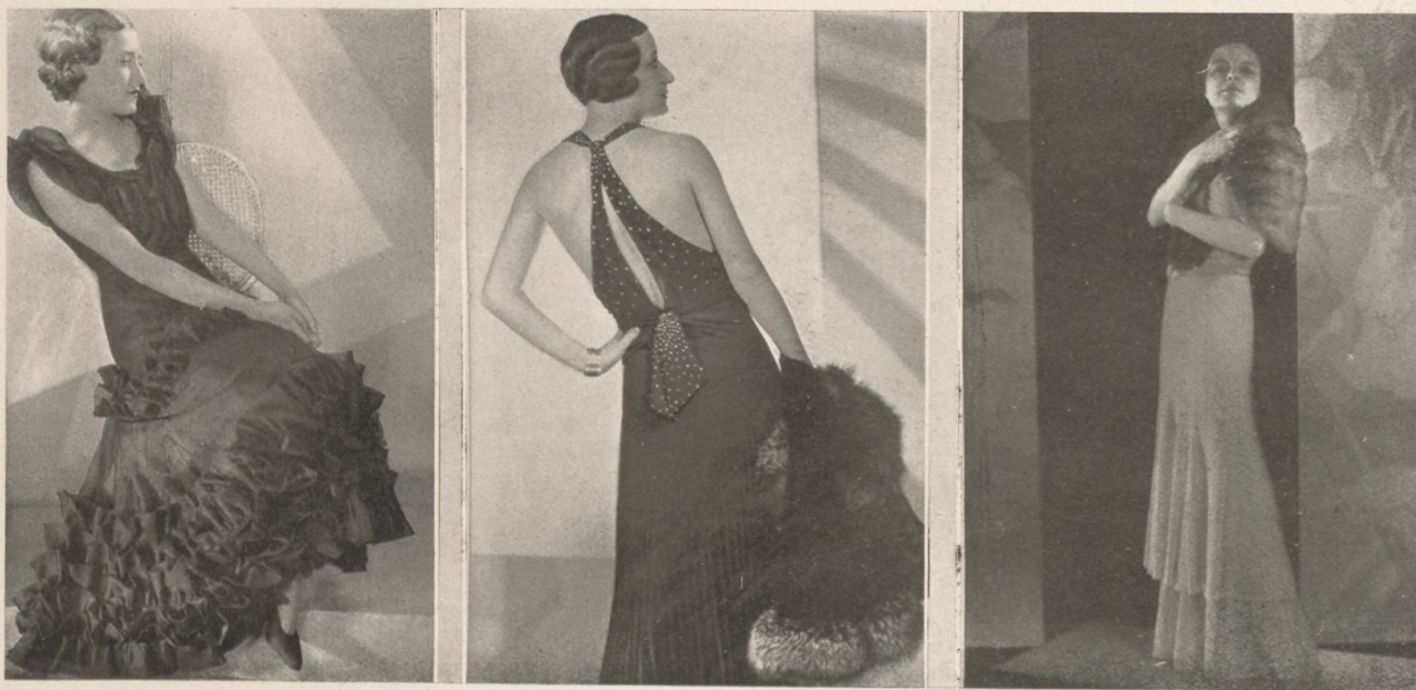
1. Lucile Paray-modell: Piros selyem grenadín kisestélyiruha. 2. Phillippe et Gaston-modell: Fekete zsorzszt estélyiruha strasszal hímözve. 3. Martial et Armand-modell: Rózsaszín csipke estélyiruha nyestkeppel.

A mélyen kivágott keskeny kis escarpin cipők ugyanabból a selyemből készülnek, mint a ruha színéhez ki-