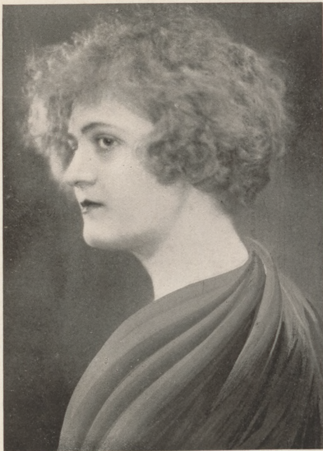
Vidané zsarnai Geál Hanna Brunhuber udv. és kam fénykép'sz felvétele

Kedves Szerkesztő! A napokban az óbudai dombok alján barangoltam, hol feltűnt nekem egy épülő háromemeletes keskeny ház. Megtudtam, hogy itt lesz József Ferenc főhercegék jövődöbéli lakása. Innen szép ugyan a kilátás, de mintha a környék nem volna eléggé biztató? Innen a Margitszigetre néztem, ahol már készítik a tavaszi kosztümöt, — meg azután távcsövön egy párt láttam, — sőt