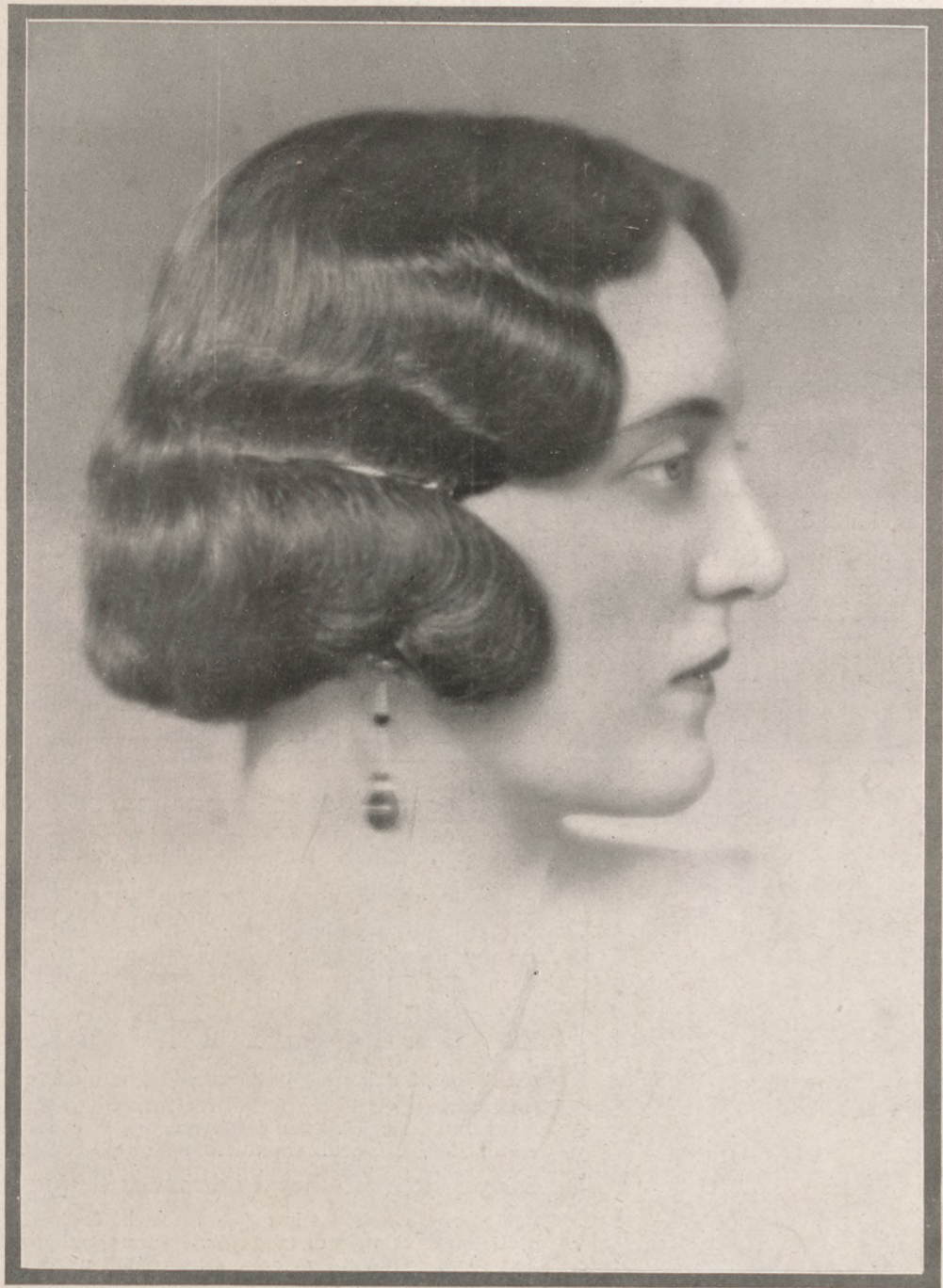
Gróf Pongrácz Jenőné Veres udv. és kam. fényképész felvétele