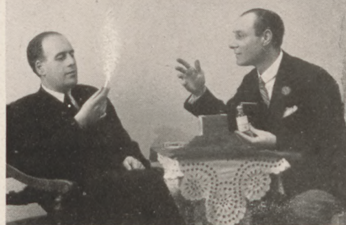
(Horthy Miklósról)

Védje egészségét és használja a szabadalmazott DR. MED. HERCZECH-FÉLE