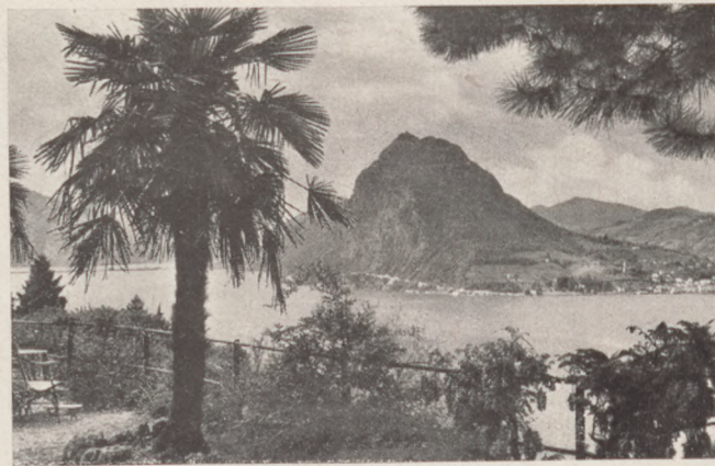
Tavaszi társasutazásunkról: 1. A comoi-tó (Como a Stadionnal). 2. A luganoi tó partján (szemben a San Salvatore hegy).