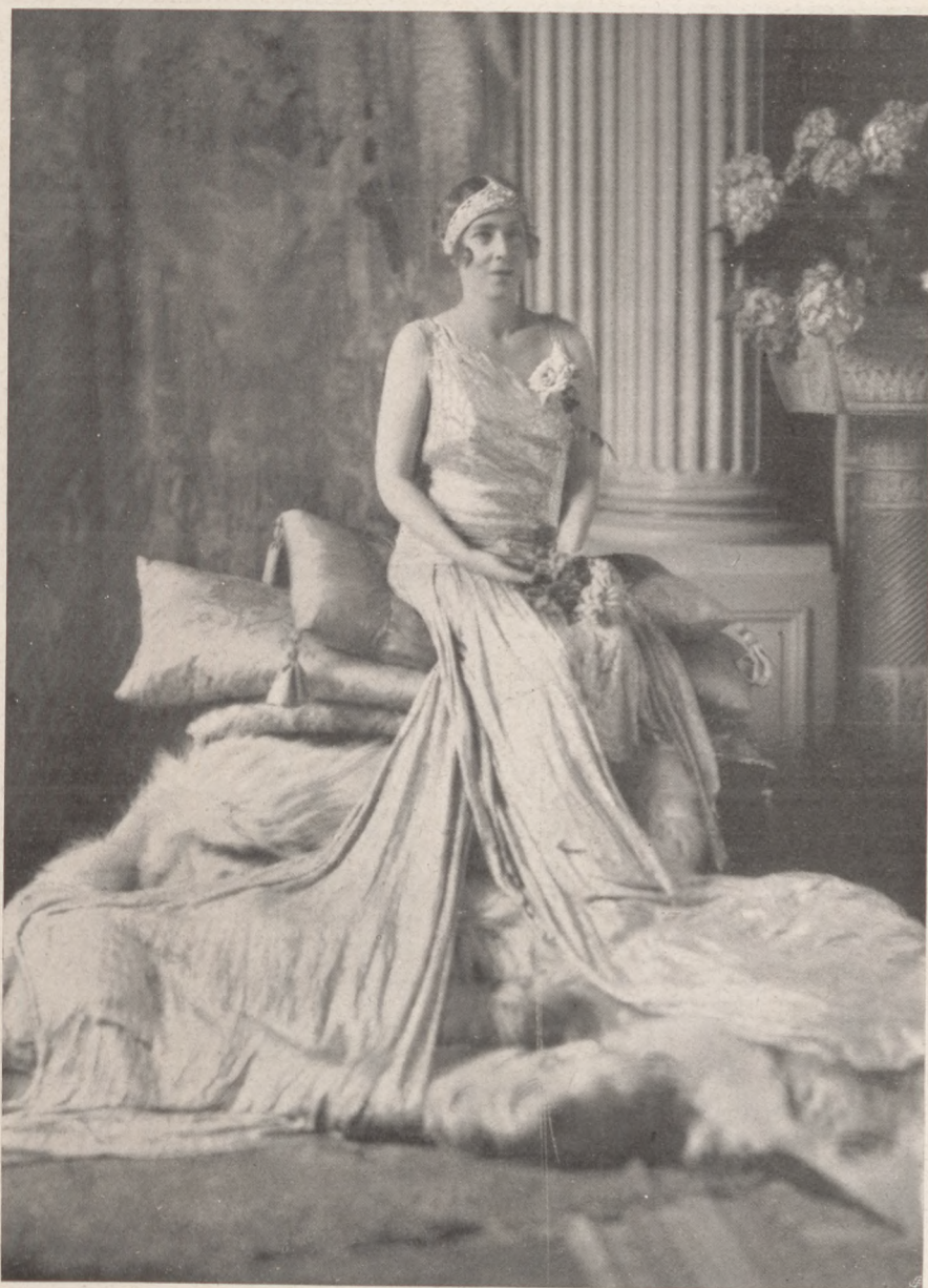
Erzsébet belga királyné Atelier Eva Barrett (elvétele (Róma))