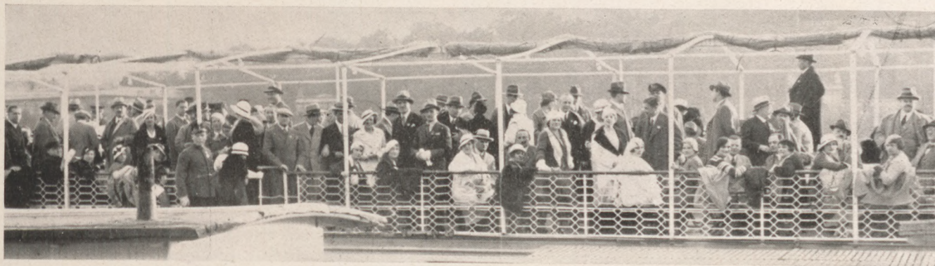
Kirándulók a „Deák Ferenc” fedélzetén