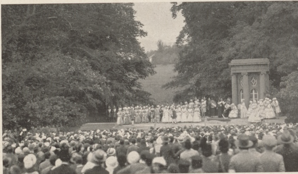
Szabadtéri operaelőadásról a tatai Esterházy-parkban. Jelenet a „Csavargó és királyleány”-ból