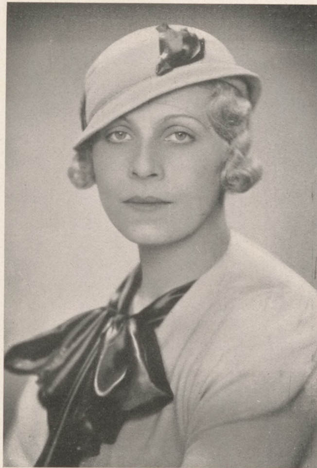
Balonyi Ágostonné Halász Studio felvétele

PAYING GUEST (fizető vendég) akciónkat megindítottuk s már eddig is sikerült több földbirtokoshoz „megfelelő” fizető vendéget ajánlani a nyári hónapokra. Ismételten felkérjük tehát azokat, akik a nyár egy részét mérsékelt áron (körülbelül 4—5 pengő) óhajtják vala-