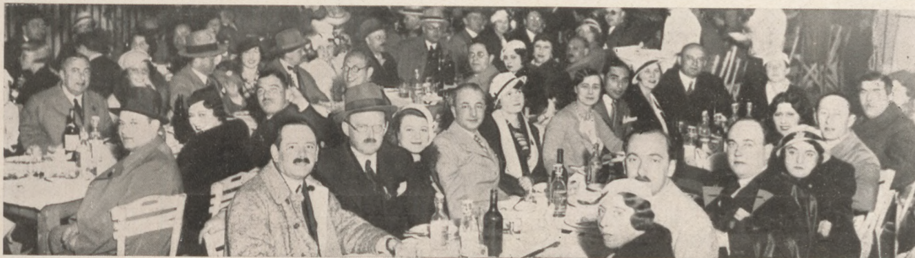
A Mágusok hajókirándulásáról. Vacsora a leányfalusi Kaszinóban

— Nemrég a Ringen találkozom egy régi ismerősömmel. „Szerencsés jó napot, kedves Singer úr!” — köszöntöm őt kitörő örömmel. „Őn téved! Én Singer úr testvérbátyja vagyok!” — mondja ő. „A bátyja?” — gondolom magamban. „Miért adja ez ki magát a bátyjának?” — Mire emberem újra megszólal: „Az öcsém kéreti önt, hogy kölcsönözzön neki száz schillinget.” — Erre én ezt felelem neki: „téved, én a Werbezirk testvérhuga vagyok!”.