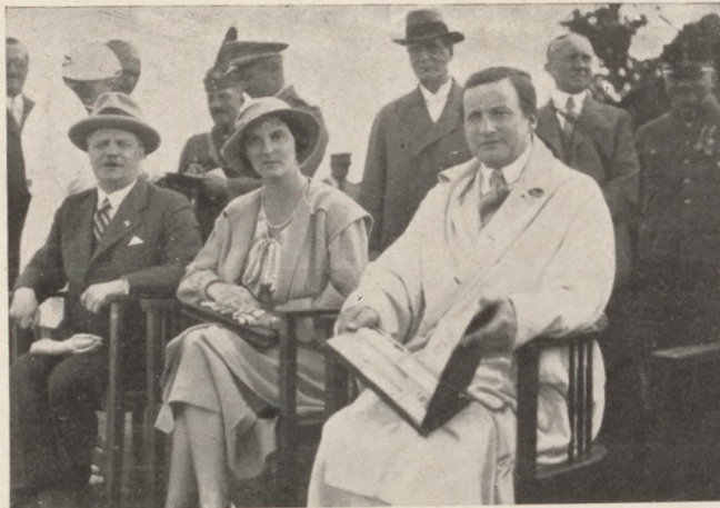
A gyöngyösi repülőtéren. Ülnek: József Ferenc főherceg és felesége Anna főhercegné, Fabinyi Tihamér miniszter. Állnak: Rákossy György légügyi felügyelő, Hódossy Gedeon képviselő, Puky gyöngyösi polgármester, Mátyás altábornagy.

Ezerhatszáz kézcsók. Még mint fizikai teljesítmény is komoly dolog a kézcsókkal járó fizikai mozgás — ezerhatszáz-