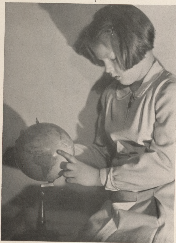
Kinsky Maya grófnő

Előfizetési árak: Egy évre 25 P., félévre 14 P., negyedévre 8 P. Utólag fizetve negyedévre 10 P. Egyes szám 80 fill.