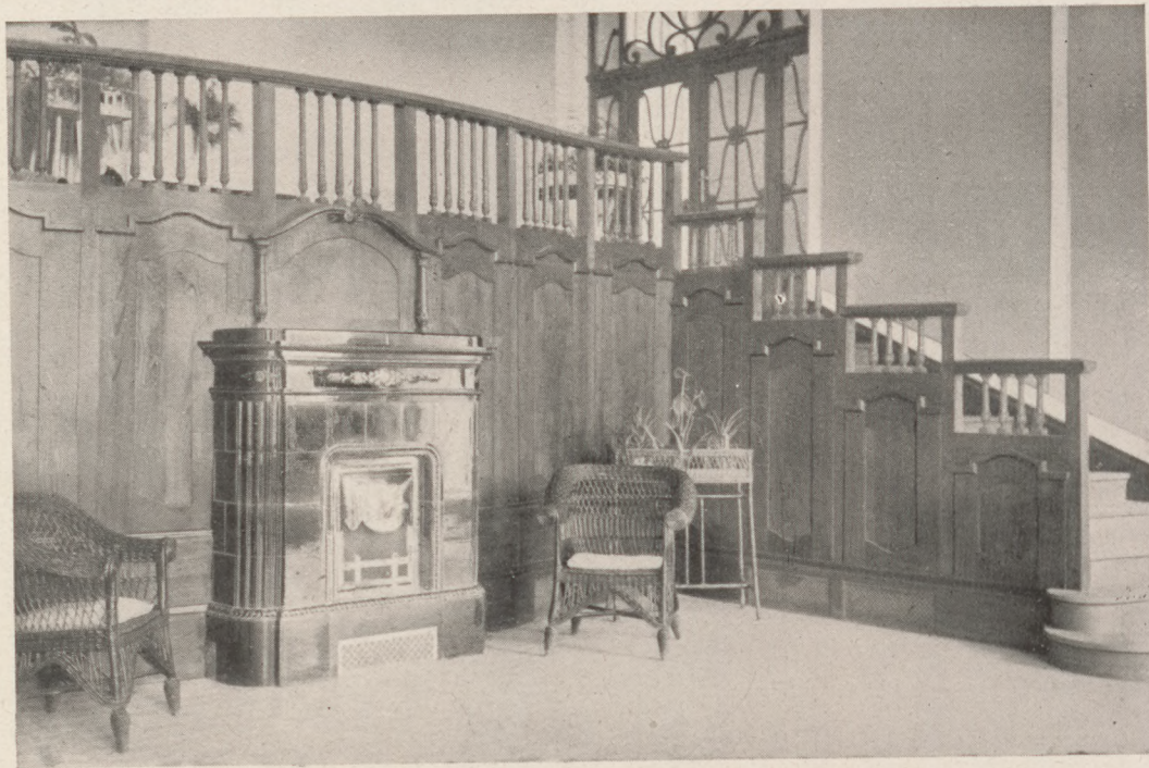
RÉSZLET A HALLBÓL