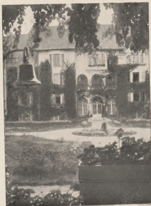
RÉSZLET AZ INTERNÁTUSBÓL

Külföldi legjobb intézetekkel egyszínvonalú, modern, teljes gyakorlati és elméleti kiképzést nyújtó háromévfolyamos, női gazdasági szakintézet négy középiskolát végzett leányok számára. — Festői vidék. Hegyi levegő. Idegen nyelvek beható tanítása, olcsó díjak. Tisztviselők és katonatisztek részére nagy kedvezmény.