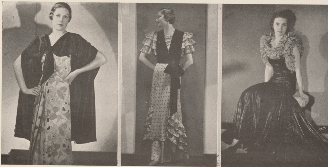
Párisi divát. 1. Lucien Lelong-modell: Estélyi ruha krém alapon halványzöld, piros és fekete muszlinból. Hozzá festői fekete szatin-krepp. 2. Worth-modell: Fekete selyem pettyes muszlin estélyi ruha. Hozzá viselhető a kis mellényszerű fekete bársonykabát. 3. Marcel Rochas-modell: Fekete lakkozott muszlin estélyi ruha halványkék túllfodorral.

Még egy utolsó pillantás a Jungfrau napfényben tündöklő havas csúcsára, s azután a Thuni-tó partján robotgunk Bern felé. Ott a várost megtekintettük, — persze a medvéket