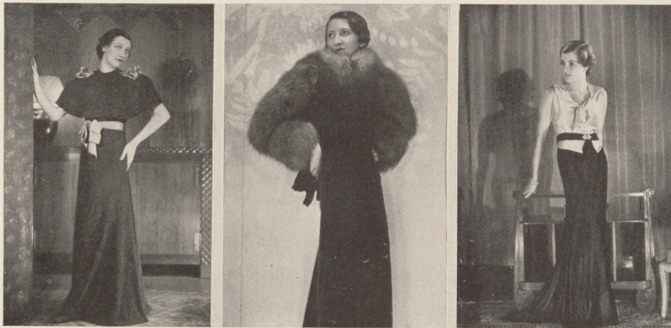
1. Worth-modell. Kisestélyi ruha fémszálakkal átszőtt bársonyból. Türkizkék tollak a pelerínen és ugyanolyan színű bársonyöv díszítik a mélyvörös modellt. 2. Molyneux-modell. Paysanor-bársonykabát kékróka dísszel. 3. Patou-modell. Uszályos nagy- estélyi ruha, kétféle színű »panne sauvage«-ból.

Igen nagy helyet foglal el a nagy divatszalónokban a