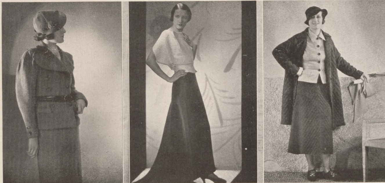
Párisi divat. 1. Bernard & C e-modell: Barna »Velaz«-kosztüm. 2. Bruyère-modell: Színházi vagy koncertruha »satin fluide« és laméből. 3. Lucien Lelong-modell: Durva gyapjúkosztüm »tussor«-blúzzal