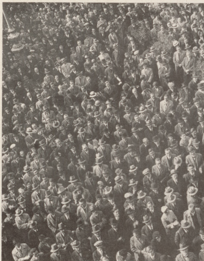
A revíziós nagygyűlés közönsége a Vigadó előtt. Schäffer Gy. felvétele Budapest, Rákóczi-út 8/a

A REVIZIÓS LIGA vasárnapi tiltakozó gyűlése csodálatosan felemelő külsőségek közt folyt le. Ötvenezer ember gyűlt össze a Vigadóban és a környező utcákban s a békeszerződés igazságtalanságai ellen tüntető magyarság szava túlharsogott a trianoni határokon. Az angol képviselők jelenléte még nagyobb súlyt adott az impozáns tüntetésnek, angol barátaink megmutatták, hogy szívvel-lélekkel mellettünk állnak.