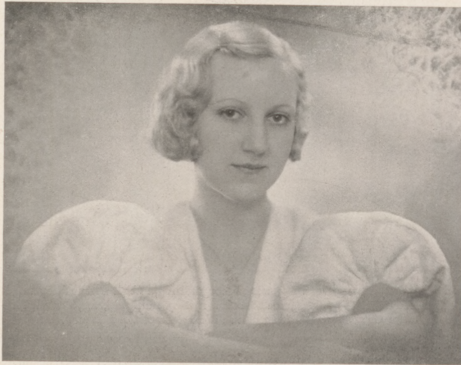
Halász felvétele (IV, Kristóf-tér 2)

TEAESTÉLYEK. Olasz-teát rendezett szombaton este a Bristolban az „Olaszország Barátainak Egyetemi és Ifjúsági Szövetkezete”. E táncestélyt megnyitották a következő párok: