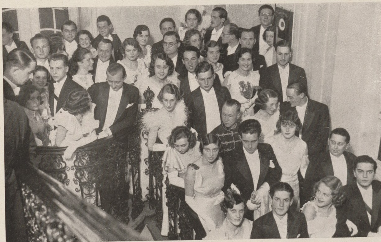
Az első bálos leányok bevonulnak a keringőnyitáshoz