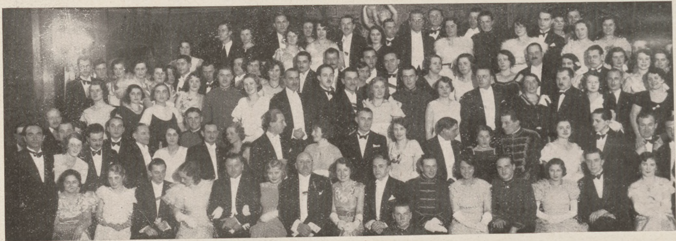
Felvidéki-bál a Gellért-szállóban