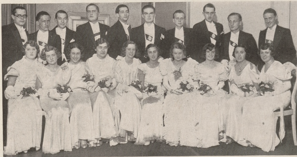
A Jogászbált megnyitó párok. (»Estélyi ruhás« csoport balról-jobbra :)