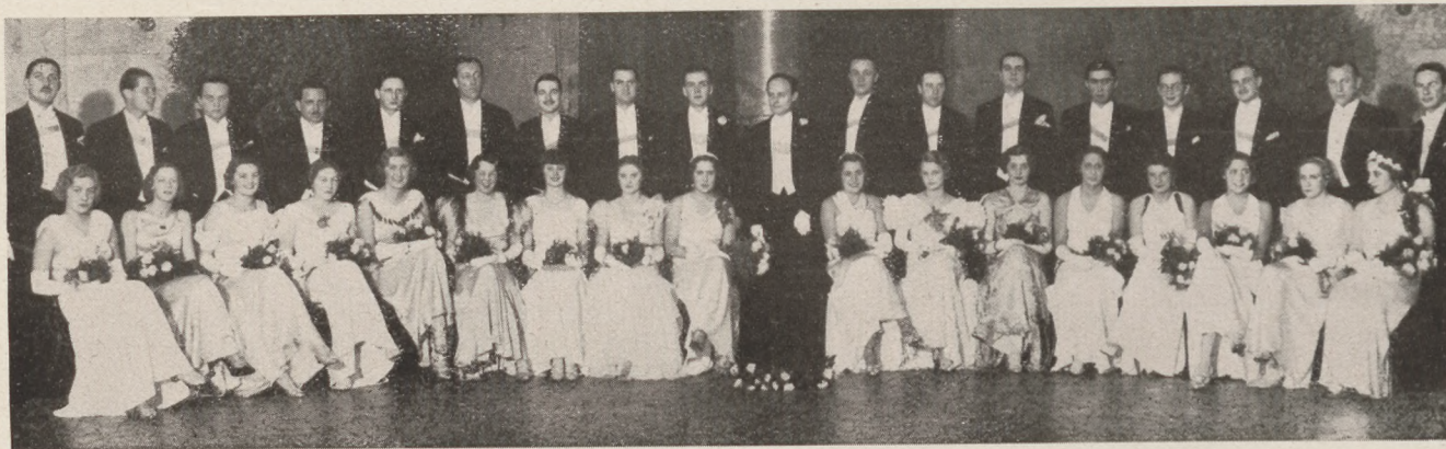
Csárdásnyitók első csoportja az Atléta-bálon.

Schäffer Gy. felvétele (VII., Rákóczi-út 8/a)