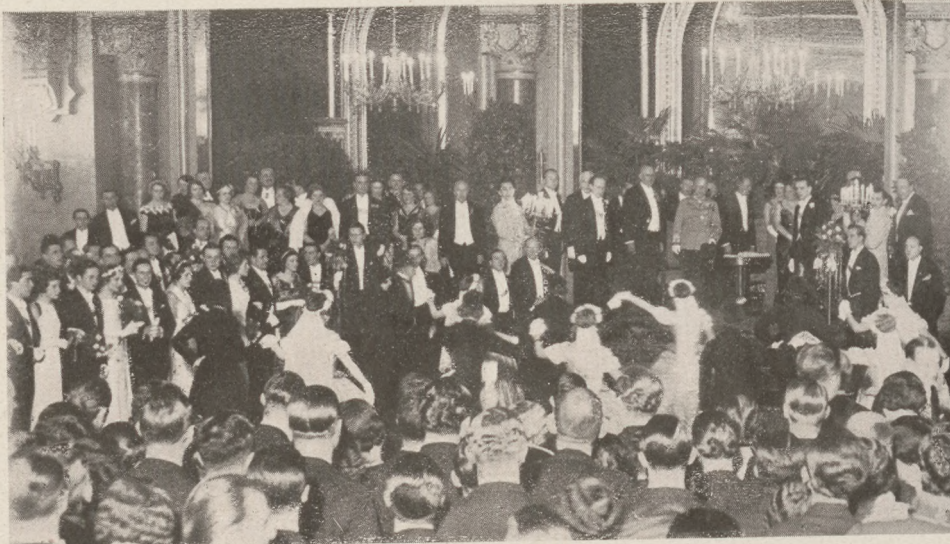
A M. Kir. Operaház balettkarának magyartáncbemutatója az Atléta bálon