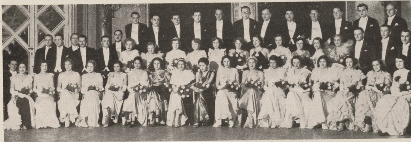
Csárdásnyitó párok második csoportja az Atléta-bálon.