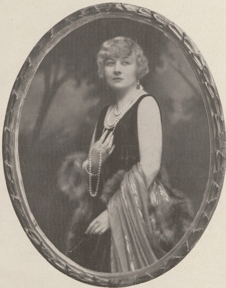
Herceg Liechtenstein Jánosné az Atléta-bálon