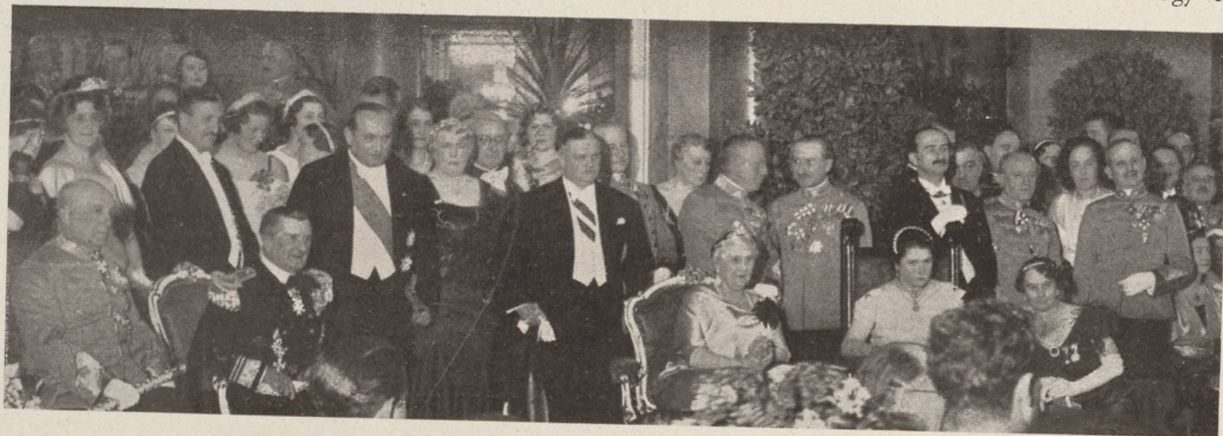
A Vitézi bál emelvényén. (Az első bálozó leányok bemutatásakor.)