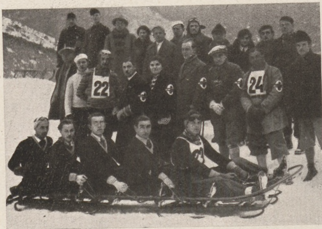
A lillafüredi bobversenyőről. A győztes csapat és a közönség egy része.

A MOKTÁR az elmúlt héten publikálta a mérlegét, amelyből kiderült, hogy az intézet az elmúlt évhez hasonlóan, több mint hétszázézerpengő nyereséggel zárta le az évet. Ez a szám a legbeszédesebben igazolja a MOKTÁR üzleti politikájának helyességét, a kitartó ragaszkodást a konzervatív elvekhez: mindenkor arra törekedtek, hogy a mobil banküzletet egyensúlyban tartsák. Ezek az elvek különösen helyesnek bizonyultak az utolsó évek nehéz gazdasági viszonyai között. A bank ez évben a múlt évhez hasonlóan, egy pengő osztalékot fizet részvényenként.