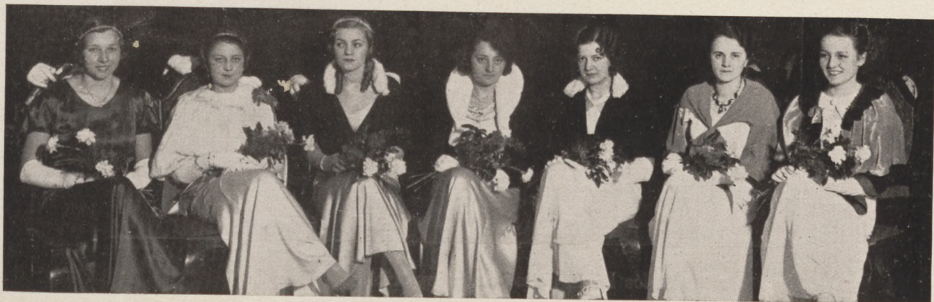
Szentesi táncestély a Bristolban. Megnyító leányok csoportja.