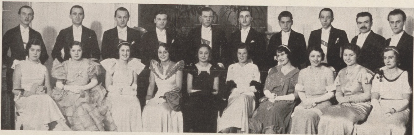
Gyógyszerész-bál a Pannonvárosban.