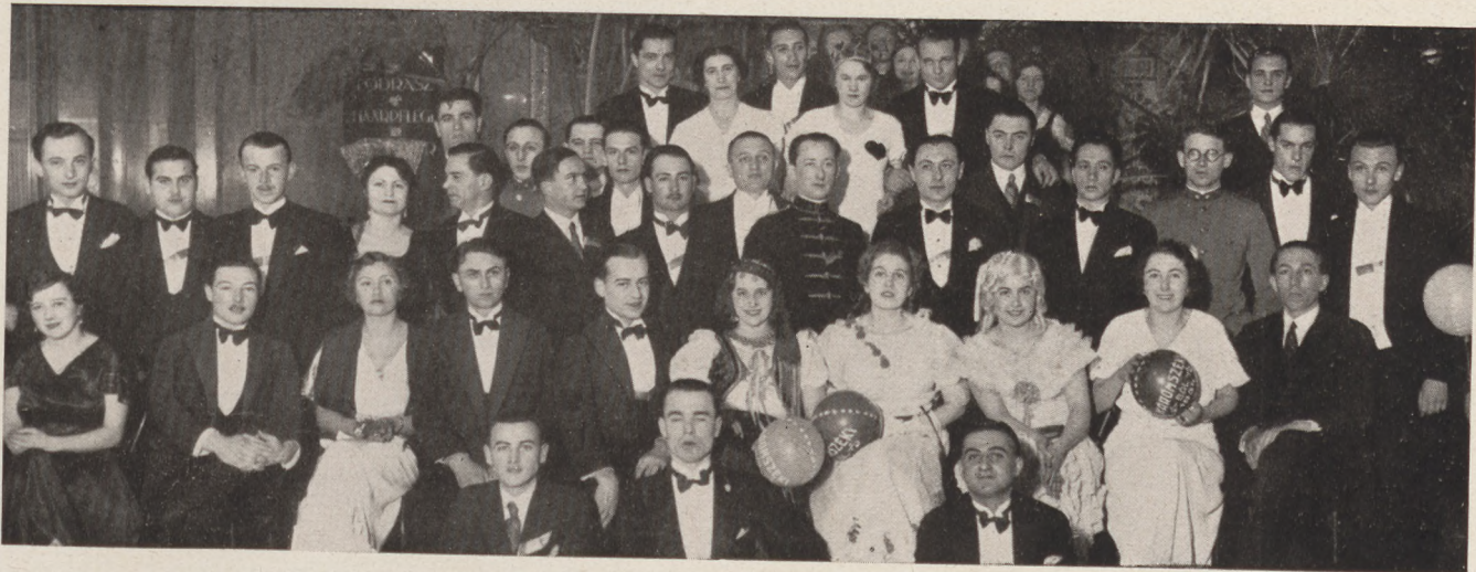
A Háromszéki jelmezbál rendező gárdája.