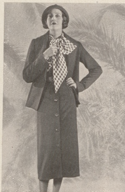
Párisi divat. 1. Molyneux-modell: Délelőtti ensemble rózsaszínű gyapjuszövetből, szürke asztrakándiszítással. 2. Patou-modell: Tengerészkek szoknya és kabát. Fehér kötött pullover. 3. Molyneux-modell: Tengerészkek ensemble, fehér-kék kockás sál.