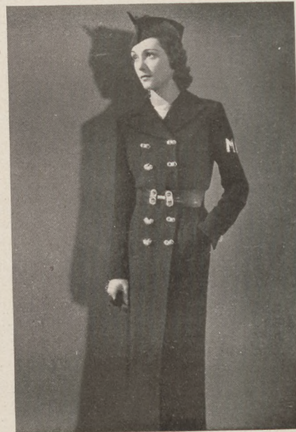
Párizsi divat. 1. Bruyère-modell. Tavaszi ensemblé. 2. Chanel-modell. Mintás gyapjú kesztüm. 3. Marcel Rochas-modell. Tengerészkek kabát ezüstdrót gombokkal. Ezüst monogram.

egybeszabott pelerinből és imprimé blúzból állnak. Igen divatos az „agneau rasé” bunda tavaszra. Kétharmad vagy háromnegyed hosszúságban készül és taftszalag díszíti a gallér alatt. A nyári estélyi ruhák Molyneux-nél princess-szabásúak, majdnem kivétel nélkül uszályban végződnek, hátkivágásuk nagyon mély, elől pedig szögletes vagy kerek a décolleté. Derékban (valamivel lejjebb csúszott a tavalyinál a derékvonal) sokszor baloldalt csokorra kötött taftt, faille, vagy organdi öv fogja le a nagy estélyi toalettet. Nyárára kocsikeréknagyságú, selyemmel alábélelt karimájú szalmakalapot hoz Molyneux. Divatszín: sötétkék, fehér, pergament és estére pasztellkék, rózsaszín, fekete.