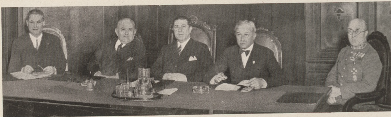
A Magyar Atlétikai Szövetség közgyűlése.