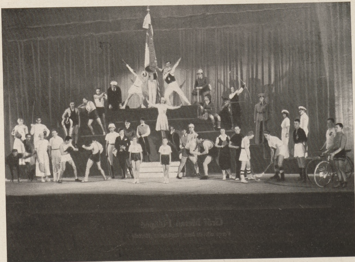
„A Magyar Sport” Élőkép az Országos Testnevelési Tanács sporttűnnepélyén a Városi színházban Rendezte: dr. Kammermayer Oszkár az OTT titkára.