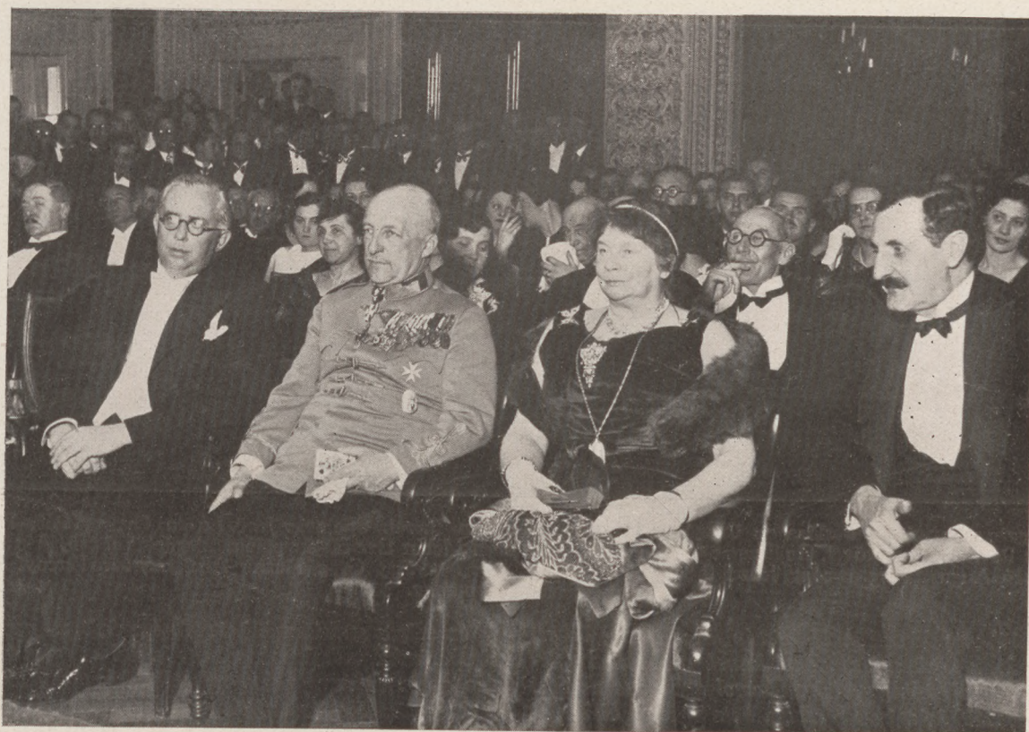
A Magyar Amateur Mágusok Egyesületének kamara-estélye a Fészek Klubban.

Előfizetési árak: Egy évre 25 P., félévre 14 P., negyedévre 8 P. Utólag fizetve negyedévre 10 P. Egyes szám 80 fill.