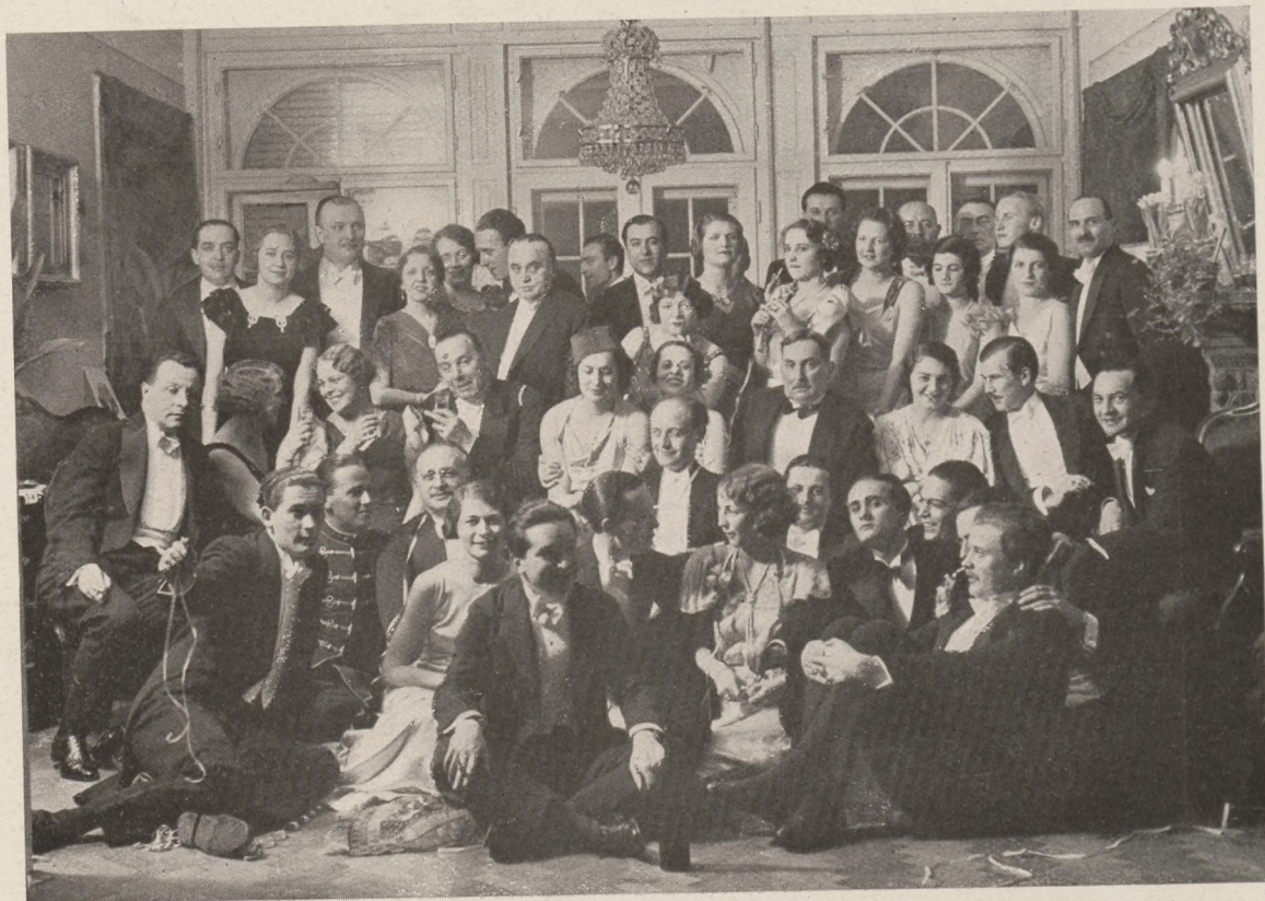
A Helmeczy-házibálról (Schäffer Gy. felvétele (Rákóczi-út 8/a))