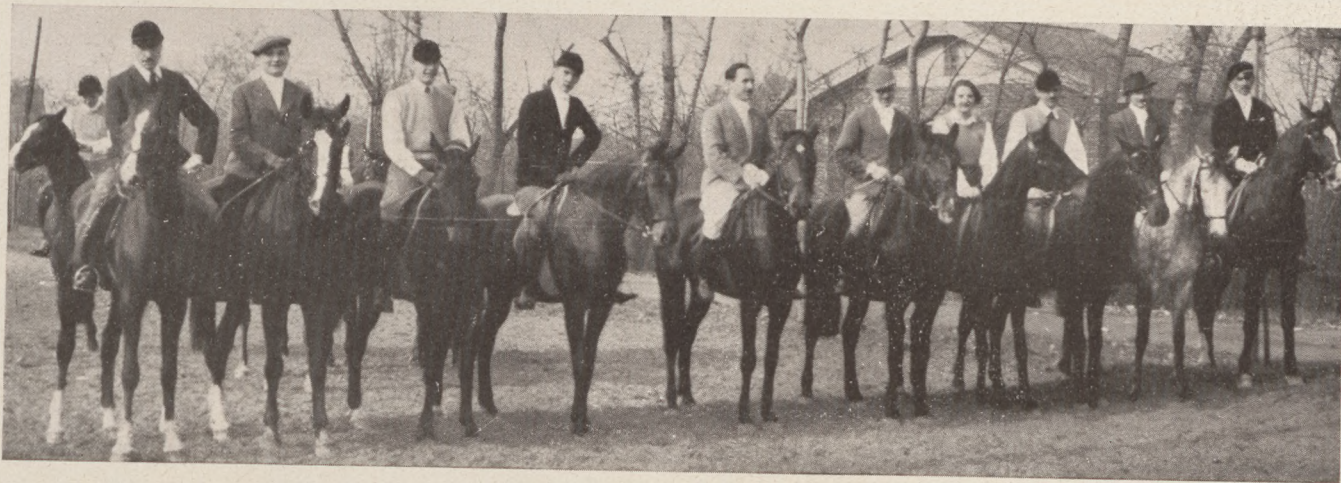
A Mezőgazdasági Kiállításon rendezett lovasmérkőzések résztvevői.