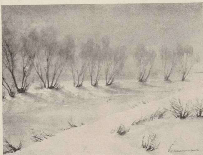
Téli napfény. R. Barabás Gizella festménye.

Bizony, akkoriban még nem Keszthelyen, az akadémián tanulták az úriemberek a gazdálkodást, sem Halleban, hanem otthon az istállóban, meg az ekeszarvánál, meg a szérűskertben. Még akkor nem igen volt jószágkormányzó, meg főintéző, még csak intézője sem, csak legfeljebb egy-egy nagy mágnásbirtoknak, nem úgy, mint ma, mikor néhol a „főintéző” jóformán csak annyi földet „intéz”, amennyi a markában elférne.