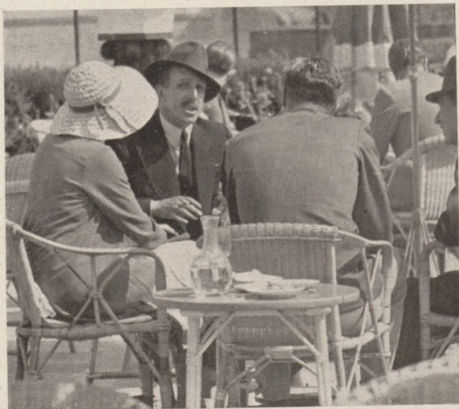
Cannesban. Alfonz volt spanyol király a Carlton terraszán. uzsonázik.

A társaság élén ma a nemrég elhunyt Albert belga király nővére, a „vendomi hercegnő” áll. Uralkodók, fejedelmek, nagyhercegek és mindazok, akiket a Góthai Almanach udvar-