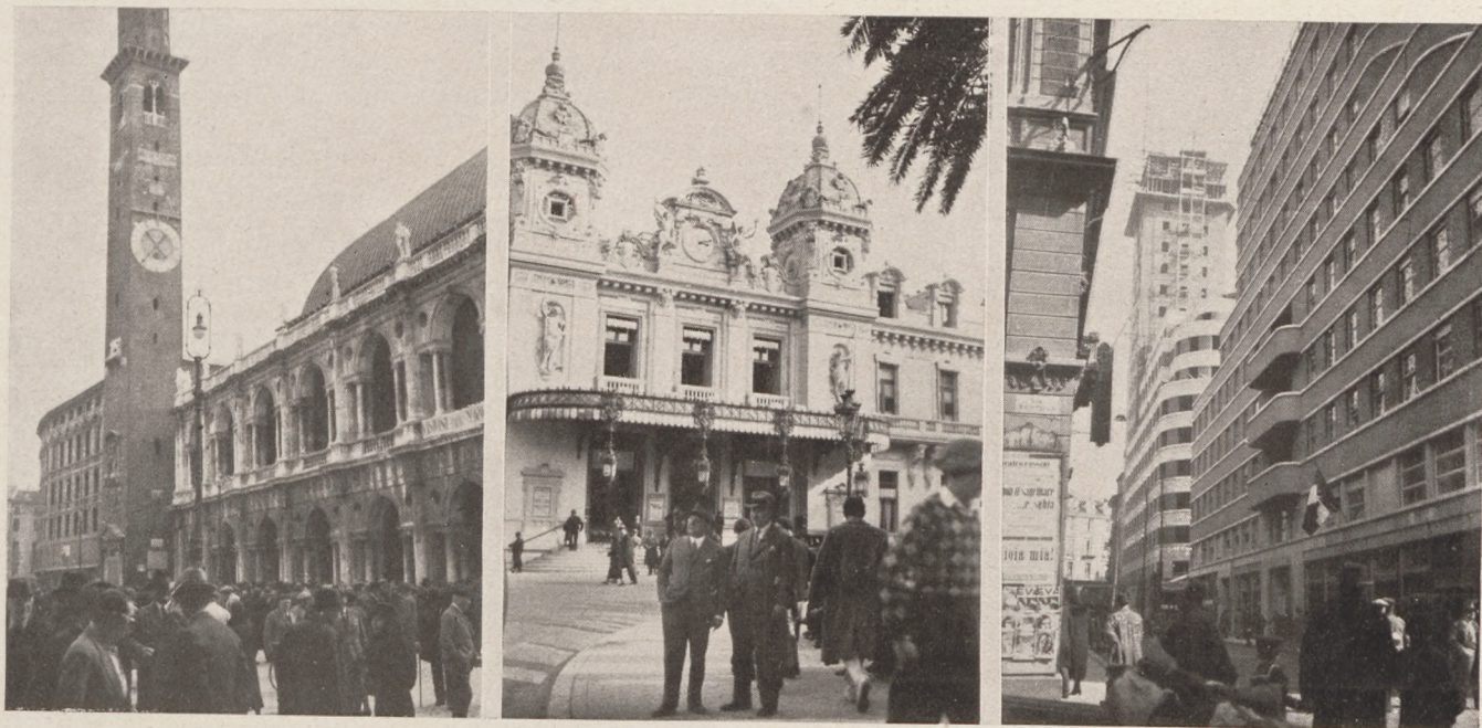
Három korszak — architektúrában. (Autótutazás a Rivierára.)

A Ville Franche-i öbölben az angol gibraltári flotta vendégeskedett néhány napig. Tiszteletükre tüzijátékok voltak, virágszata és bál. Remek képet nyújtott egy ilyen esti parádé: a frakkos estélyi ruhás közönség között egy-egy hódítóan elegáns tengerészisztizti gála ruha.