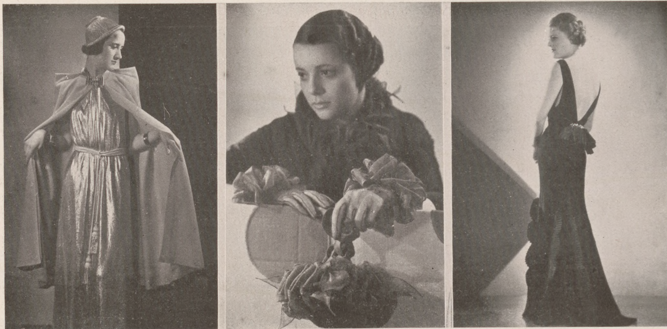
Párisi divat. 1. Bruyère-modell: Aranylamé-ruha bojtos spárga övvel. Aranylamé kalap, narancsszínű gyapjucape aranycsattal. 2. Patou-modell: Nyakrüss, keztyű, táska gesztenyeszínű organzából. 3. Jenny-modell: Fekete romain és faille estélyi ruha.

testhezálló aljak követik a mély, gazdag ráncokban lehulló szoknyákat, Rochas és Schiaparelli szigorúan szabott szűk „balayouse”-ruhái mellett békésen megférnek az üdén, könyvedén dolgozott modellek. Molyneux síma szoknyáinak, Lanvin magas empirederekainak és Vionnet klasszikus szobrok redőzetére emlékeztető pompás alkotásainak ugyanannyi hívük van, mint Mainbocher ragyogóan fiatalos organdiruháscáinak vagy Lelong angolosan fölényes „grande robe”-jának. Minden szép és minden viselhető, ha