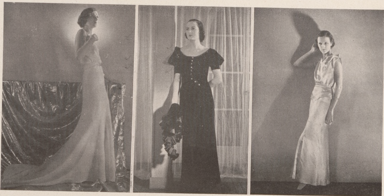
Chanel-modellek. 1. Estélyi ruha rózsaszínű selyempikéből hosszú uszályal. Strasszgombok és strasszal díszített öv. 2. Diner-ruha velurból, taft nyakfodorral. 3. Fehér satin estélyi ruha.

Molyneux alkotásai a páratlan elegancia és jóízlés jegyében állanak. Egyes mintás ruhafelsőrészei magasan, nyakig