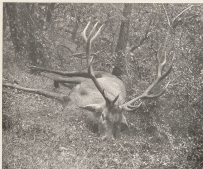
Derék tizenkettes szarvasbika. Lötte és fényképezte Marótpusztán (a Vértes-hegységben) Nadler Herbert

ÚJ MÉRSÉKELT ÁRAKKAL, mivel új helyiségében olcsóbb házbérrel erősen csökkentette regieköltségét.