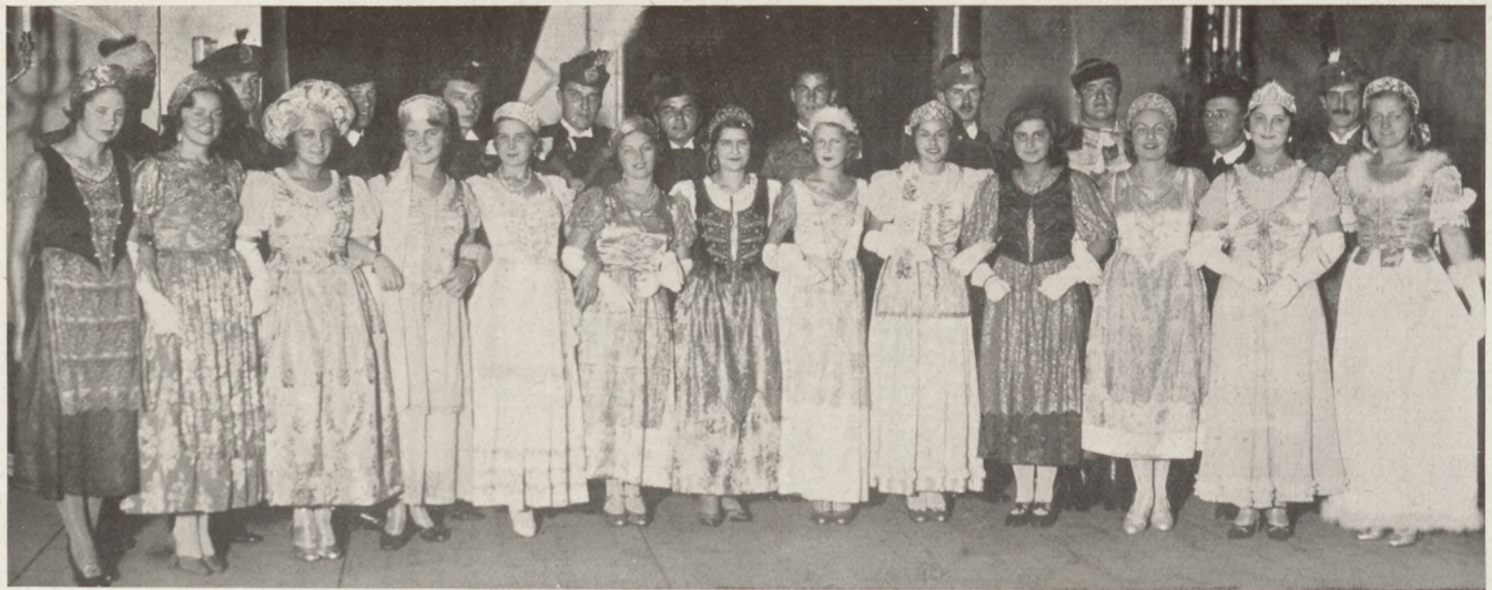
A Magyar Bálról: A Magyar palotásban résztvevő párok

A második felvonás után az élénk premiér tapsviharban sokan kiabálták: