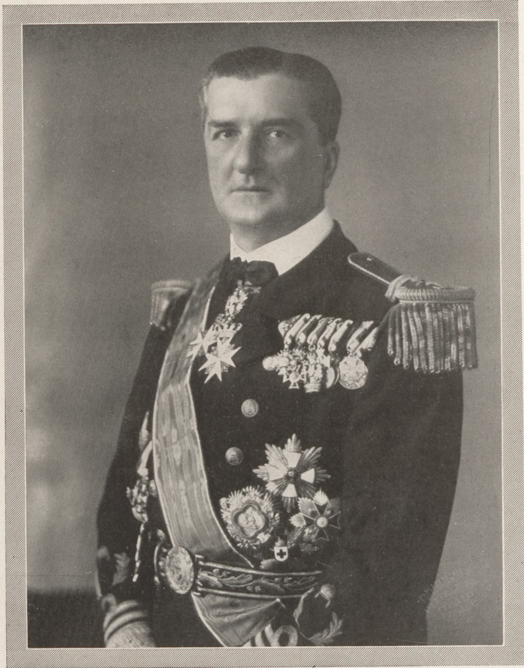
Horthy Miklós (Bevonulásának 15 éves jubileumát ünnepelte)