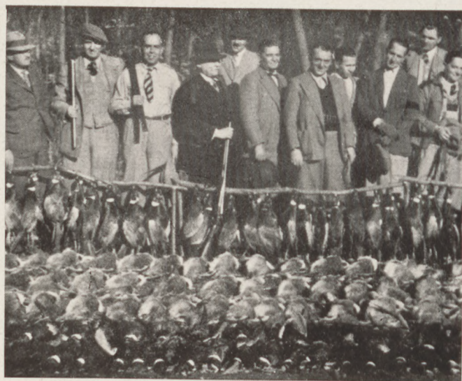
Olasz vadászvendégek a mezőhegyesi állami birtokon