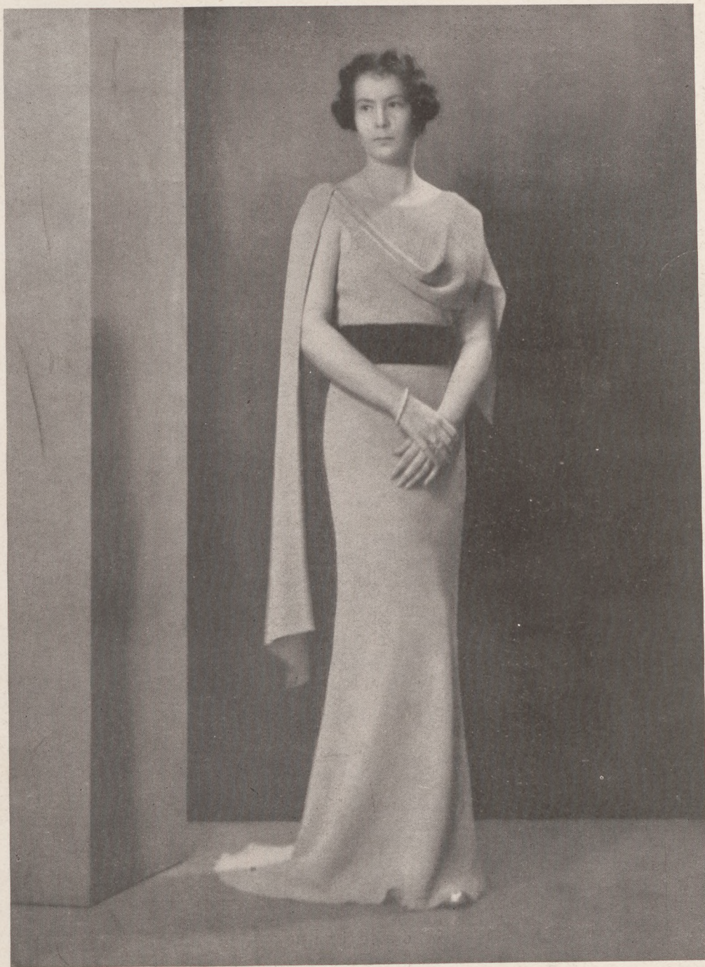
Magdolna főhercegnő a Katolikus Társaság bálján