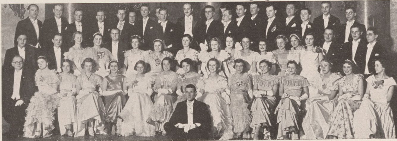
A Katolikus bálról. A Menuettet táncolók csoportja

Régi dolog hogy ha valaki túl merészkedik azon a körön, ameddig a tehetése ér, akkor könnyen baj érheti. Elfogja a bizonytalanság, mint az eltévedt embert a vadidegenek közt. Valami efféle jut az eszünkbe a Magyar Színház ujdonságának, a „Viki”-nek bemutatója után: Röck Marika az idegen, aki járallan területre tévedt. A darab? Bónyi Adorján a régi bihari életet próbálta a színpad számára átmenteni, de úgy, hogy a főszerepet s ezen keresztül a darabot is Röck Marika egyénisége diktálta neki. Így történt azután, hogy a darab a második felvonásban már elveszti a talajt, a harmadik felvonás operettszerűsége pedig minden csak nem operett. (Ábrahám Pál két száma csak egy csepp ebben az operettizű légkörben.) A darab azonban, egy-két szervi hibájától eltekintve, mégis csak szórakoztató és mulatságos; a baj főleg ott van, hogy Röck Marika tánc és ének nélkül olyan, mint egy szárnyaszegett madár. Hamisak a mondatai, a mozdulatai — állapítsuk meg kertesés nélkül —, ez nem neki való. Maradjon meg csak ő az operett túllfodros, flitteres világában, az neki való. A vígjátékot, azt bízva másokra, akik ehhez jobban értenek. A darabot különben a közönség igen melegen fogadta és sokat tapsolt a primadonnának, valamint a kitűnő főszereplő gárdának.