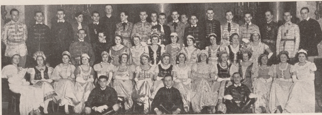
A Katolikus bál palotás nyitó párjai Schäffer Gy. felvétele (Rákóczi-út 8/a)

Felelős szerkesztő és kiadó: MIAKICH KÁROLY Főmunkatárs: UJHELY JÓZSEF Kiadja „A Társaság” Irodalmi Lapkiadó R.-T. Nyomatott Pápai Ernő műintézetében, Budapest.