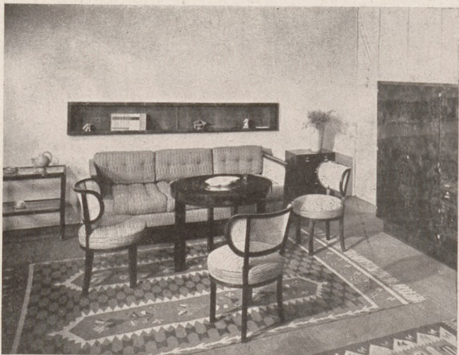
Készítette Nagy Antal és fia kft. lakberendezők (IV, Váci-utca 36)

GEBAUER Gellért-kávébáza (Horthy Miklós-út 1.) az előkelő közönség állandó találkozóhelye.