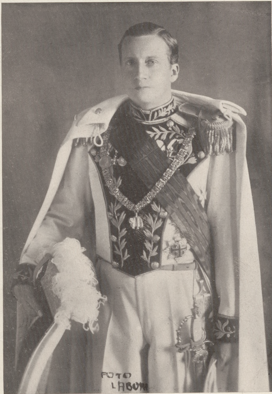
József Ferenc főherceg a Jeruzsálemi Szent Sír lovagrend nagykeresztese és rendtartományi helytartója