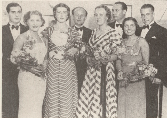
Nyitópárok a MAC kékesi sportbálján.

Pesttől, annál népesebbek azonban az úri birtokok és az őszi bíborpompában ragyogó erdők. A politikában csend van, a vadászterületeken ellenben dörög a puská. Alig egy-egy időnként felbukkanó érdekesebb hír jelzi csak, hogy azért van politika is ebben az országban — a politikus urak most nem egymással, hanem az erdők vadjaival vannak elfoglalva. Legfeljebb néhány intrika fűszerezi olykor a vadászmulat-