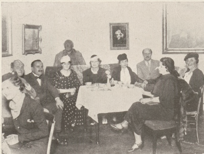
A Nemzetközi Clubban