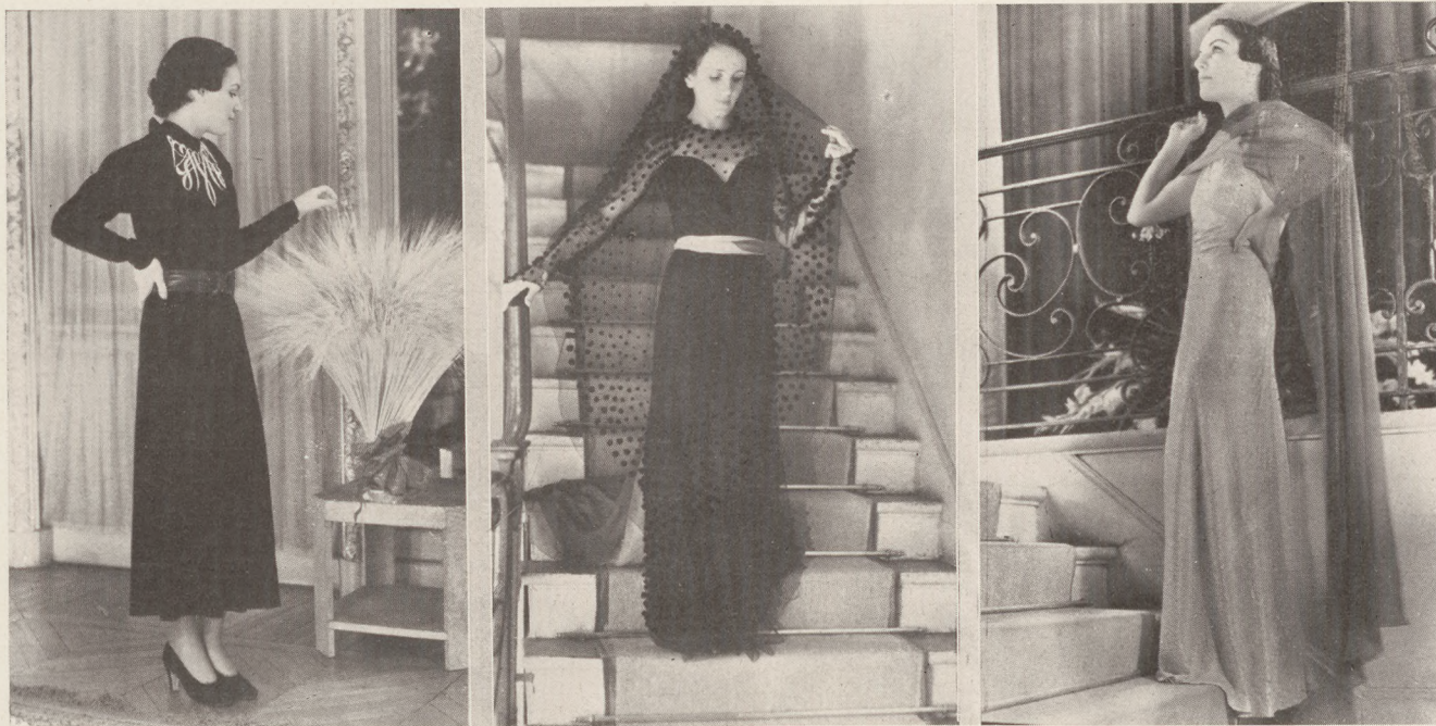
Párisi divat. Nina Ricci eredeti modelljei. Közli Biróné Balogh Böske. 1. Délutáni ruha kék selyemből fehér domborúhímzéssel a nyakkivágás körül. 2. Estélyi ruha tüllre gerrilétt-hímzéssel. 3. Estélyi ruha fehér- és ezüstlaméból, lila és rózsaszínű mousseline-écharpe.

bevallani nekünk, horgászoknak? Hát most legyen szíves, menjen rögtön vissza a vízbe. Én egy horgászellenőrt nem mentek ki a Balatonból.