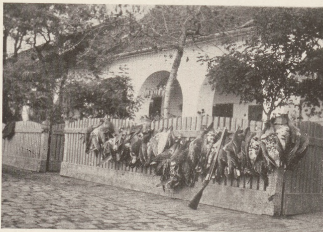
Csendélet a hortobágyi csárda előtt.