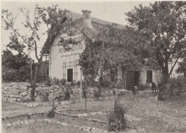
Pettkó Zsigmond pincegazdasága Balatonfüred

Egyszer csak Móricz Karcsi eszébe fölcillan egy lehetőség. Összeség barátjaival. Aztán odamegy Molnárnéhoz: — Mutassa csak asszonyság azt a cipőt!