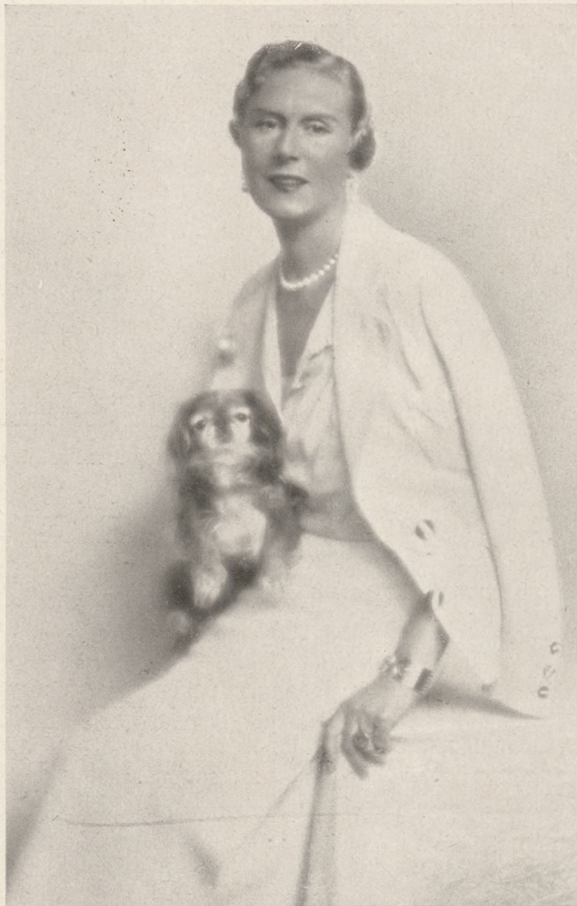
Viola montenegrói hercegnő.

Kedves Szerkesztő! Az elmúlt hetet a vidékről felrándult gazdák tették mozgalmassá. Agrárállam vagyunk — és egy földbirtokos bementése szerint, — ha már az állatokat felhozták bemutatni, — akkor a gazdáknak is érdemes megmutatni magukat. — A vásárral kapcsolatos lovas concurs-nek egy érdekessége volt, a kis Keresztes Muci abszolút szerencsés kimenetelű bukása. — Ott láttam egy ismert és