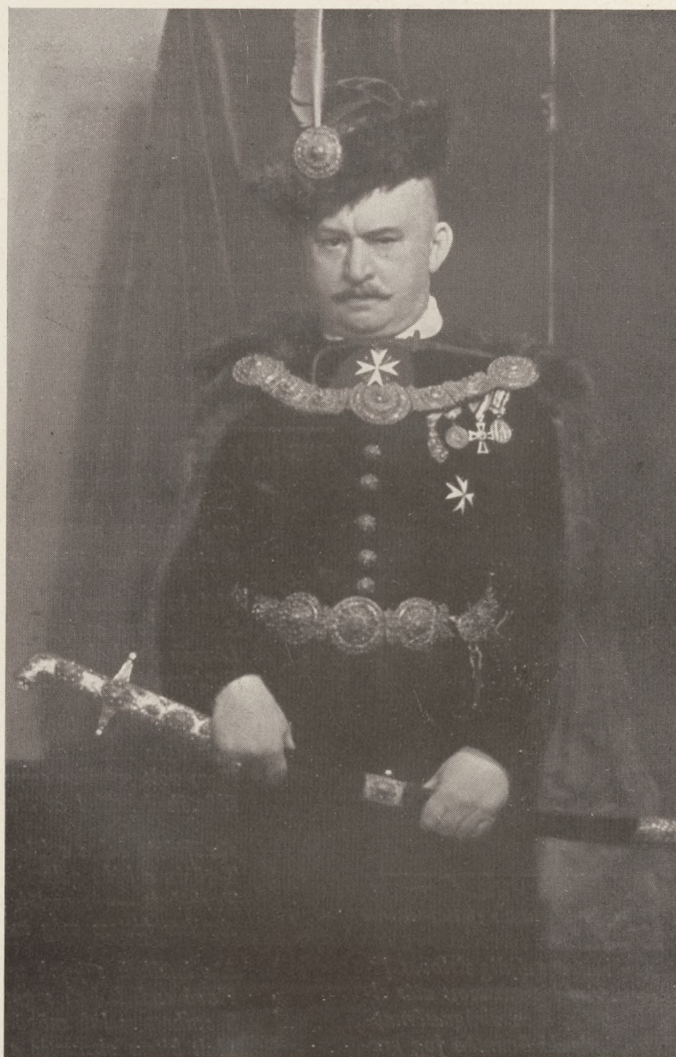
nagybányai Horthy Béla.

Előfizetési árak: Egy évre 25 P., félévre 14 P., negyedévre 8 P. Utólag fizetve negyedévre 10 P. Egyes szám 80 fill.