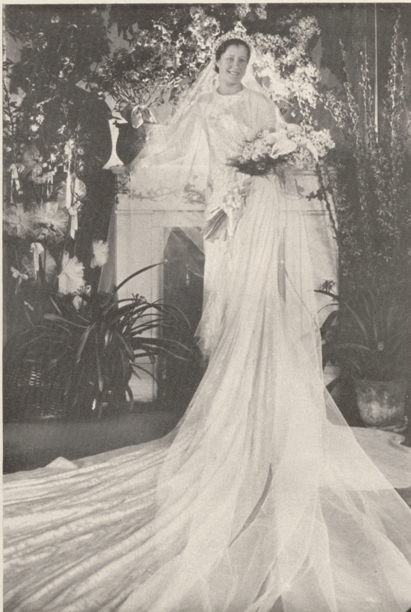
Alfonz spanyol infáns, bourbon-szicíliai herceg felesége Alice bourbon-pármai hercegnő