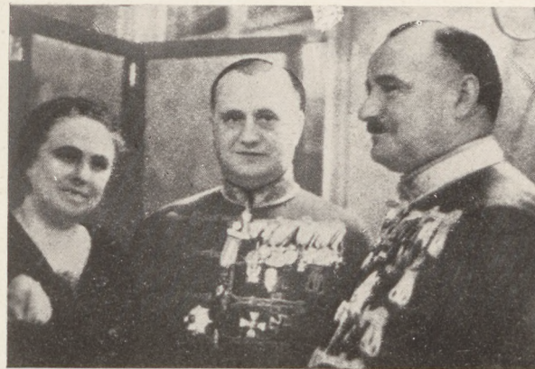
A miniszterelnöki fogadóestélyen.

sikerül megfejtenie, hogy lelkének vágyódása miatt csókolt-e meg, vagy pedig, hogy szörnyű feltevése lenne igaz. Sok idő eltelt ebben a küzködésben. Irma egykedvűen fogadta az ajándékokat, de ránézni Miklósról nem igen mert. A féltékenység örvendeztette Miklós szívét, a leány nemességével magyarázta és leküzdve magában férfi-vágyát, szelíd imádatlással csüngött rajta. Akkor annyira jutott, hogy az a csók lett életének egyetlen boldogsága. Arra a csókra gondolt folyton és csak akkor érzett örömet, ha a csók íze, meg az emlékezés Irma meleg szájára megbizsergette vérét. A najádnak most ujjongásokat, de jajveszéklő sírást is kellett hallgatni, mert végleg megbizonyosodni a leány felől nem tudott Miklós. Hiába kutatta köznapi cselekedeteit, modorát, a bizonyosság késett, mint gyógyszer, amit haldokló számára