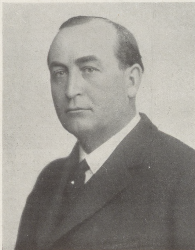
† GÖMBÖS GYULA

óriásra nő meg. Hiszen az a vad, fékezhetetlen energia, amellyel a magyarság útjain Gömbös előljárt munkában és harcban, a kibontakozás felé csak az egészen nagy és kiválasztott férfiak sajátja a borús magyar ég alatt Gömbös Gyula fanatizmusára volt szükség, hogy a körülöttünk zúgó vihar el ne söpörjön bennünket. Az értékét és a nagyságát nem a gyorsan suhanó napok, hanem a történelem fogja felmérni, Gömbös Gyula a magyarság életében egy harcos, kemény, de eredményekkel biztató korszakot jelentett. A ravatala mellett ott áll az ország: és a gyászoló száz- ezrek szemében könnyek csilognak. Olyan kevés valódi értékünk van, hogy kétszeresen súlyos, ha ebből a sorból bárki is kidől. A halott