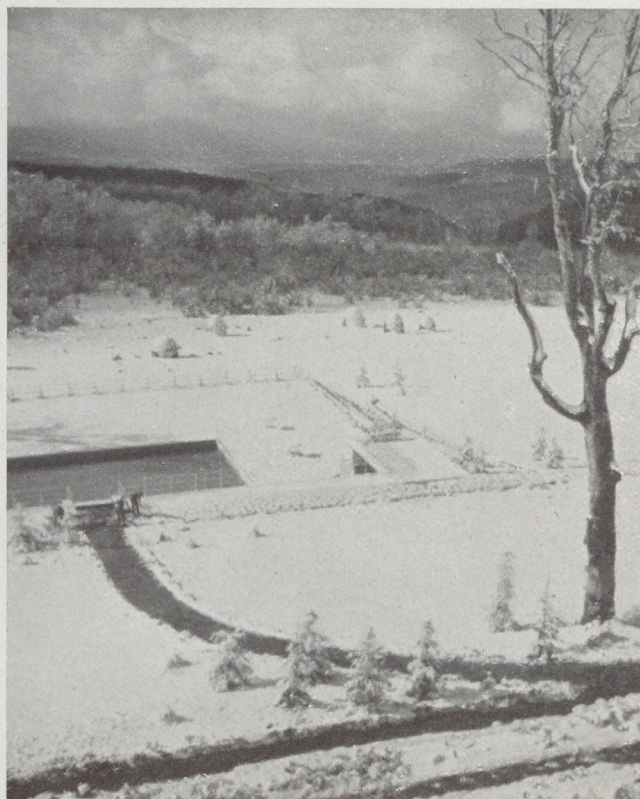
Első hó a Kékesen. (Kilátás a kékesi szállodából a félig behavazott tájra)

Megpillantottam egy távoli fényt és minden erőmet