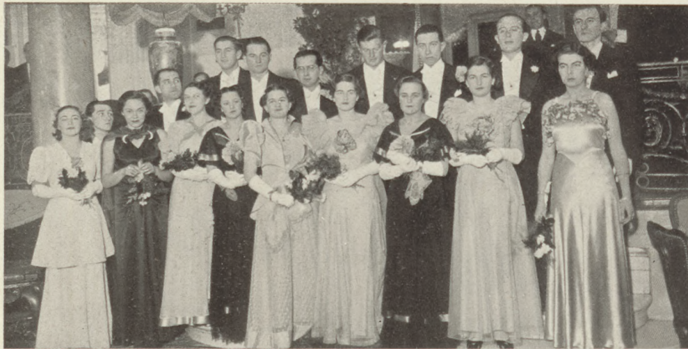
A Vöröskereszt-bál nyitó-párjai. (Neveket lásd a szövegben!)